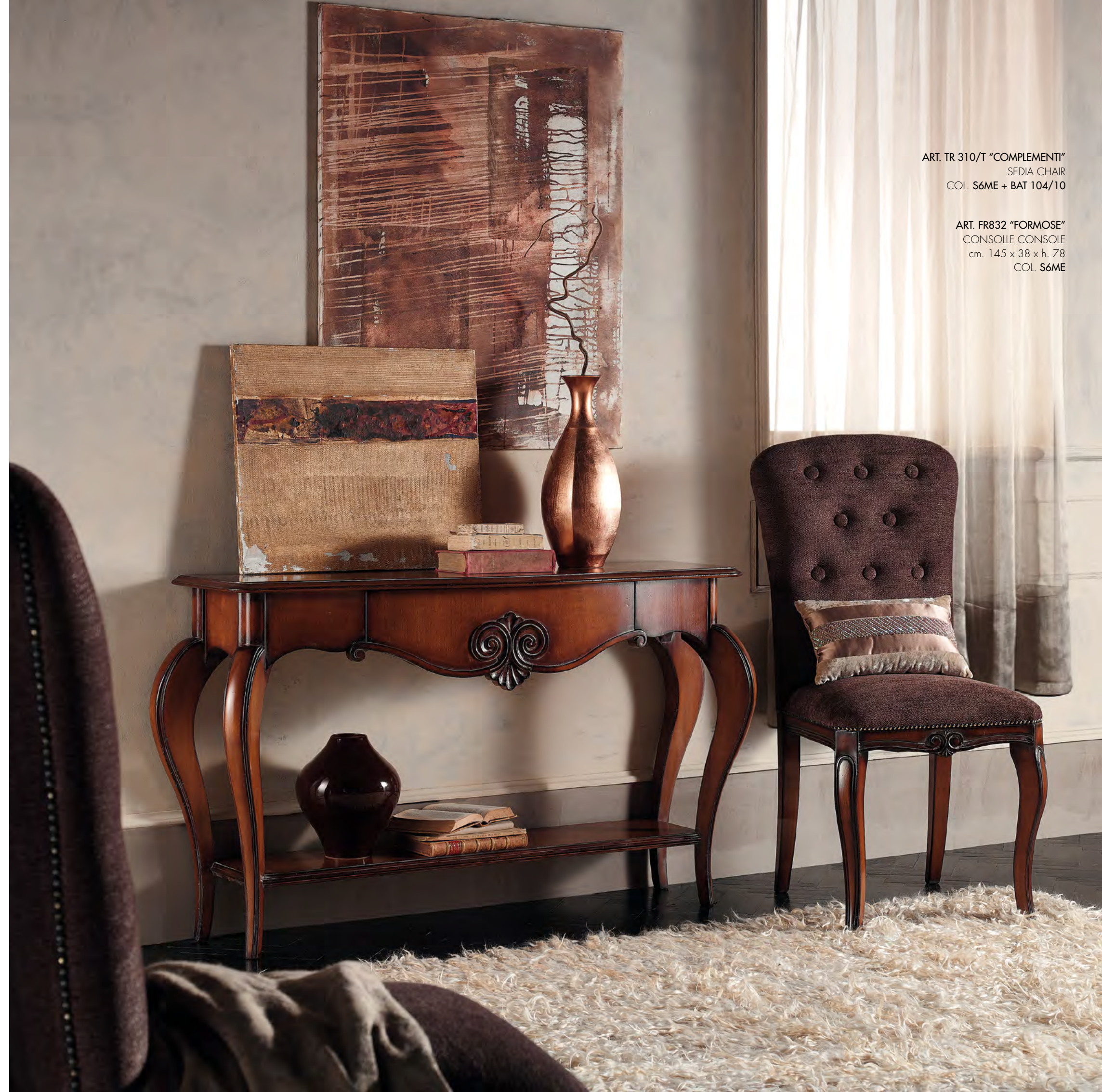
ART. TR 310/T "COMPLEMENTI" SEDIA CHAIR COL. S6ME + BAT 104/10