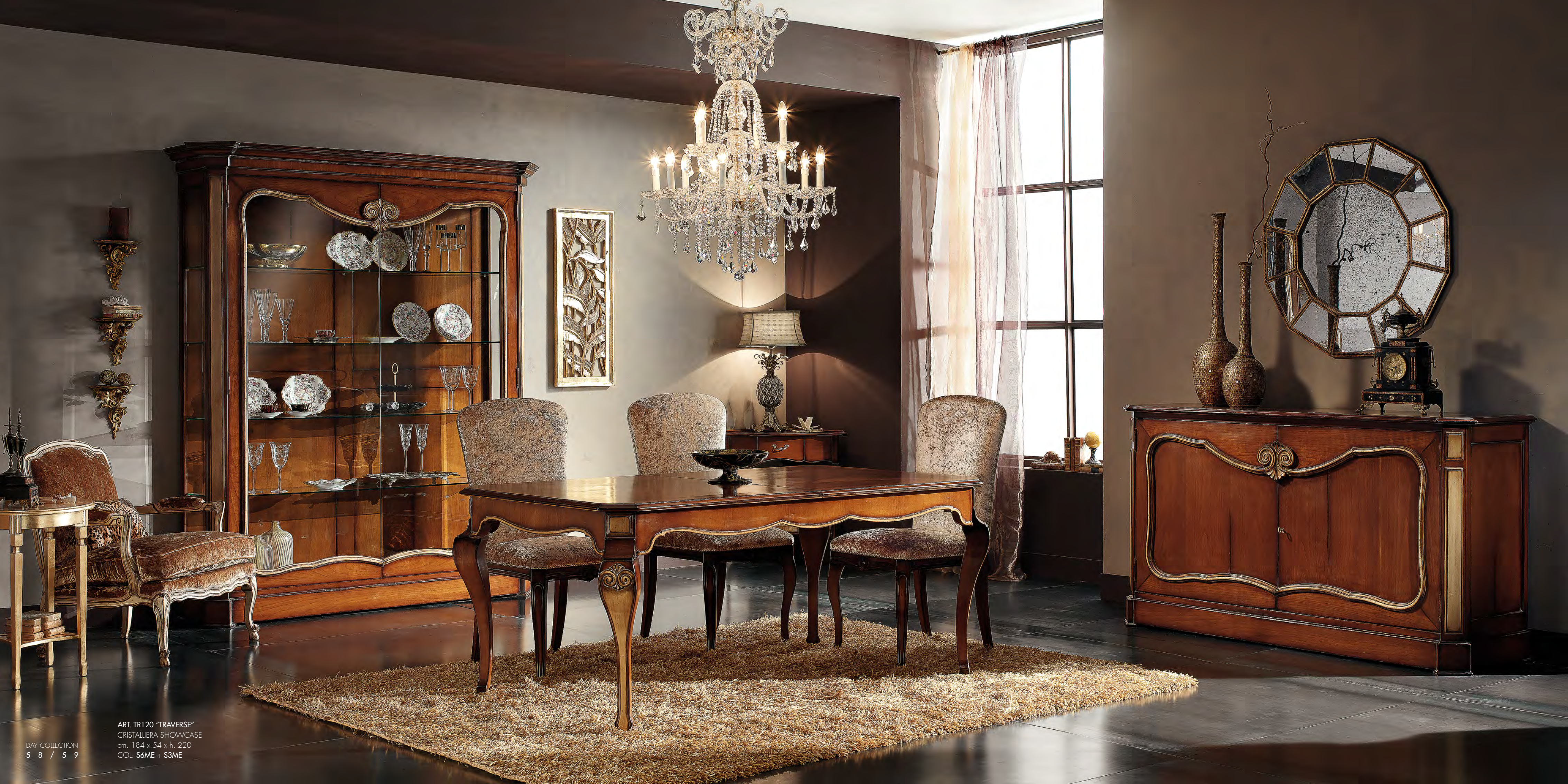
ART. TR120 "TRAVERSE" CRISTALLIERA SHOWCASE cm. 184 x 54 x h. 220 COL. S6ME + S3ME