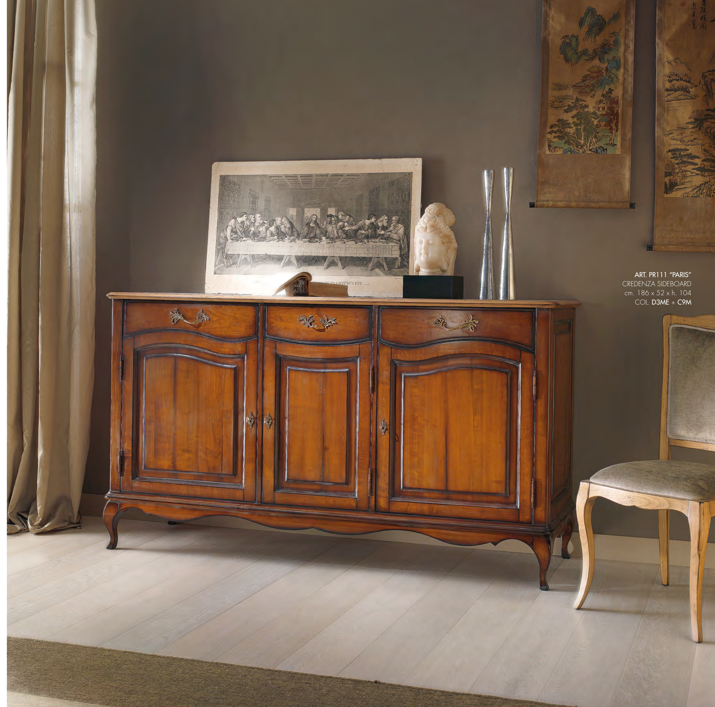
ART. PR111 "PARIS" CREDENZA SIDEBOARD cm. 186 x 52 x h. 104 COL. D3ME + C9M