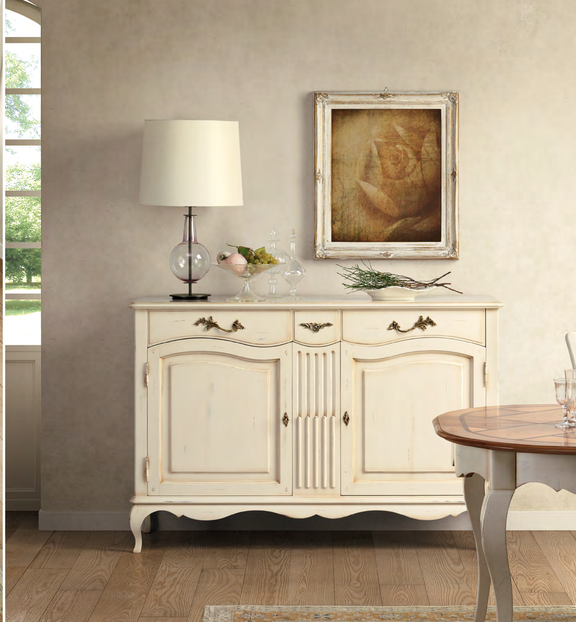
ART. PR110 "PARIS" CREDENZA SIDEBOARD cm. 157 x 52 x h. 104 COL. 8M