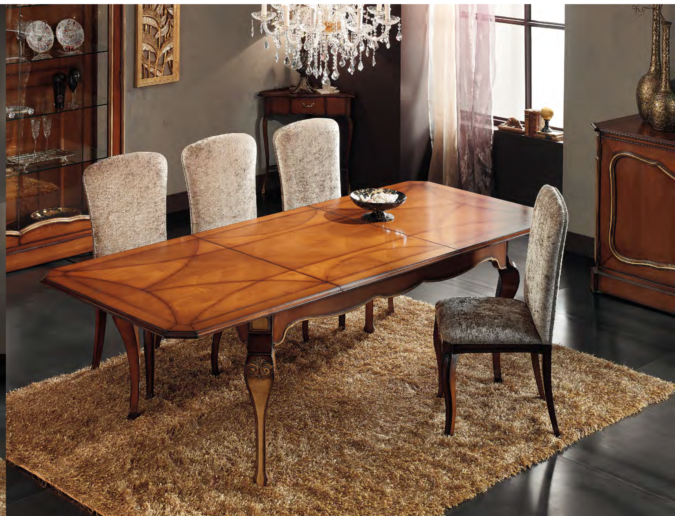
ART. TR210 "TRAVERSE" TAVOLO RETTANGOLARE RECTANGULAR TABLE cm. 180 x 110 x h. 78 CHIUSO/CLOSE cm. 290 x 110 x h. 78 APERTO/OPEN COL. S6ME + S3ME