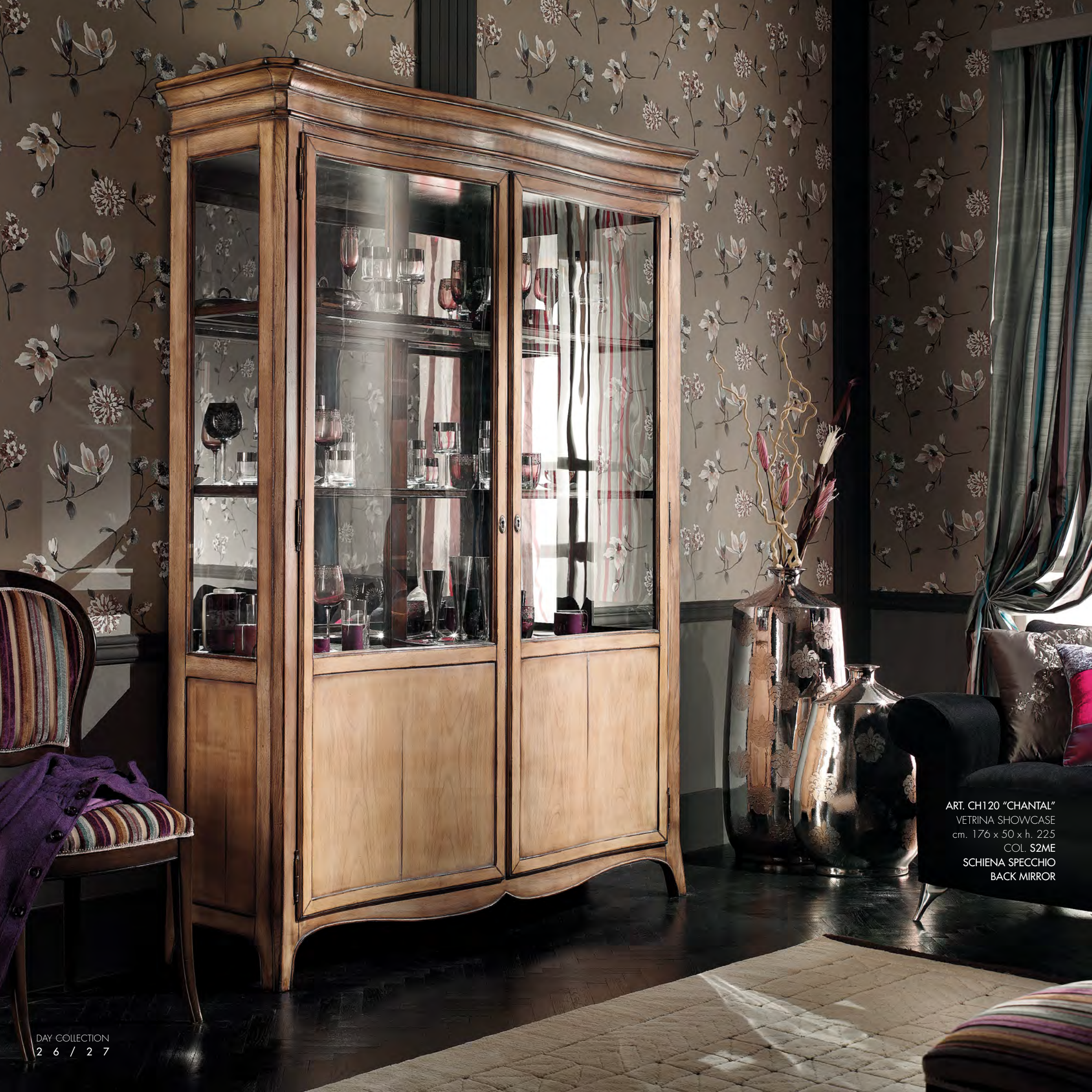
ART. CH120 "CHANTAL" VETRINA SHOWCASE cm. 176 x 50 x h. 225 COL. S2ME SCHIENA SPECCHIO BACK MIRROR

PASSIONE, IMPEGNO E PROFESSIONALITÀ, SONO QUESTI GLI ELEMENTI CHE CONCORRONO ALLA CREAZIONE DI UN PRODOTTO DI QUALITÀ UNICA, DESTINATO AD ACQUISIRE VALORE NEL TEMPO. PASSION, COMMITMENT AND SKILL, THESE ARE THE ELEMENTS THAT CONTRIBUTE TOWARDS CREATING A PRODUCT OF UNIQUE QUALITY, DESIGNED TO GAIN IN VALUE OVER TIME.