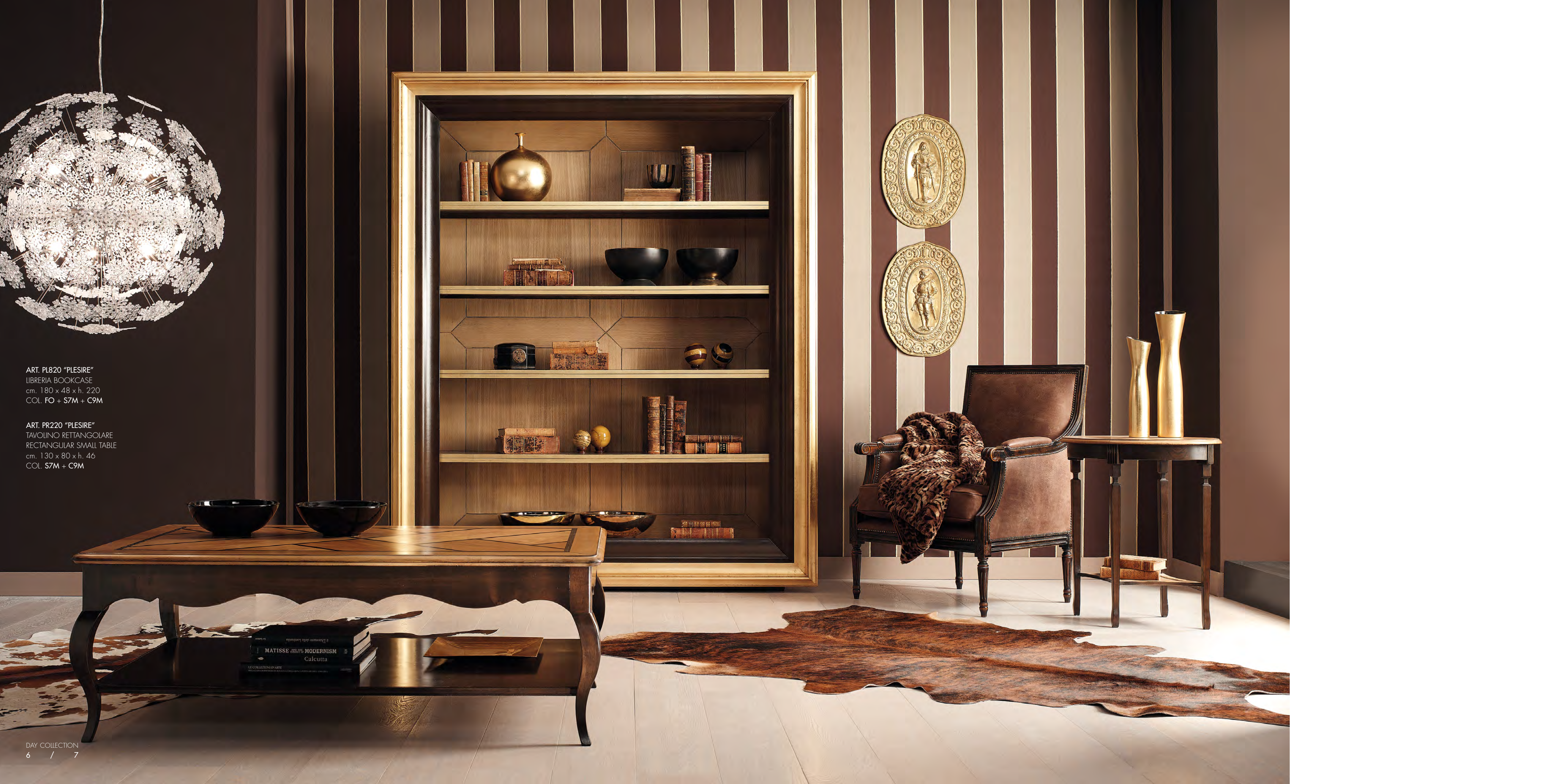
ART. PL820 "PLESIRE" LIBRERIA BOOKCASE cm. 180 x 48 x h. 220 COL. FO + S7M + C9M