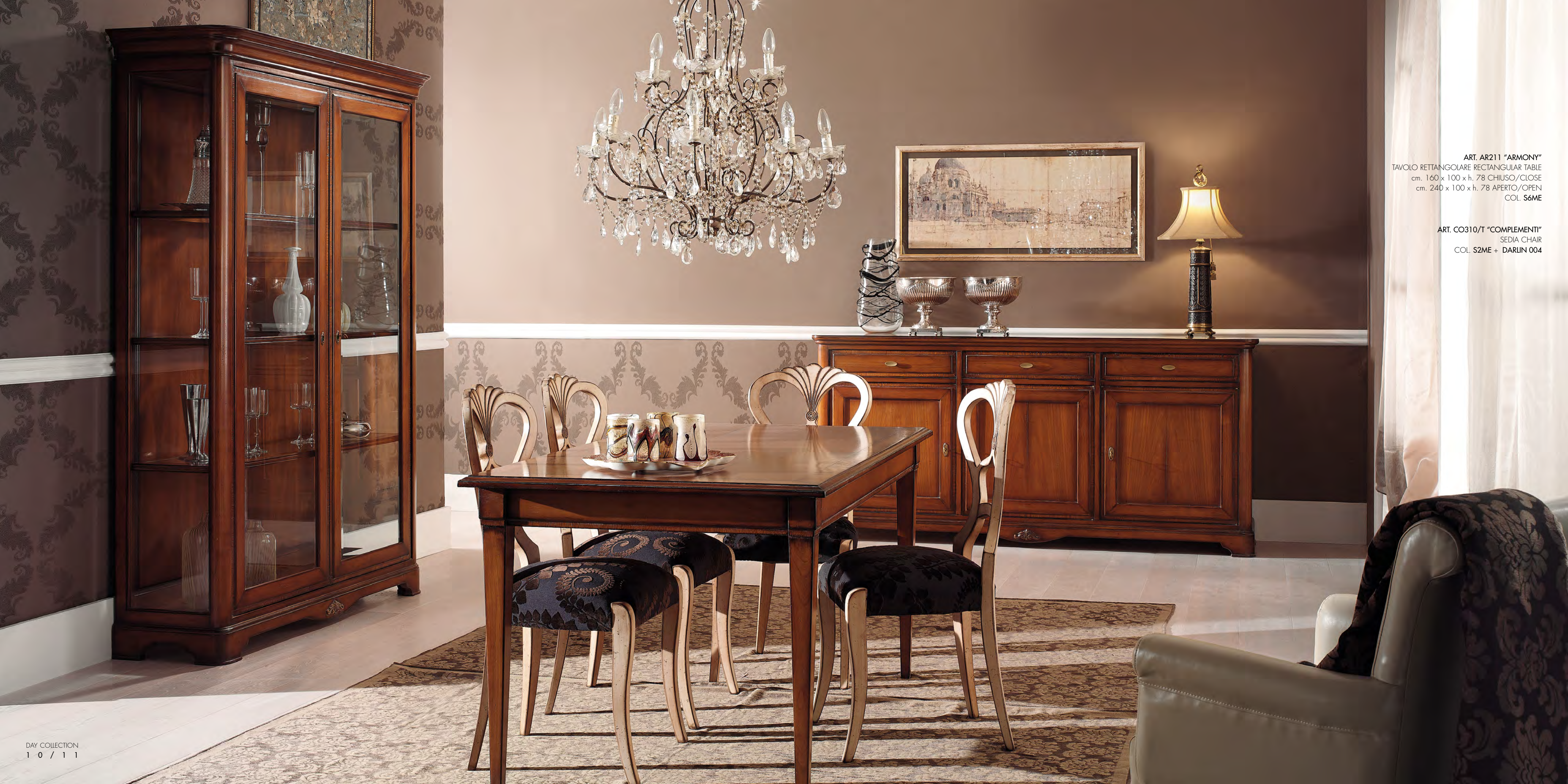
ART. AR211 "ARMONY" TAVOLO RETTANGOLARE RECTANGULAR TABLE cm. 160 x 100 x h. 78 CHIUSO/CLOSE cm. 240 x 100 x h. 78 APERTO/OPEN COL. S6ME