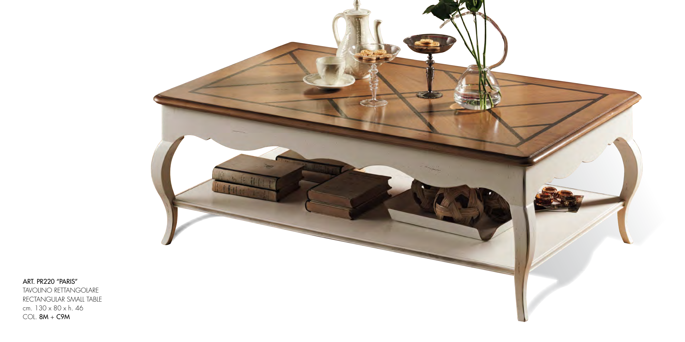
ART. PR220 "PARIS" TAVOLINO RETTANGOLARE RECTANGULAR SMALL TABLE cm. 130 x 80 x h. 46 COL. 8M + C9M