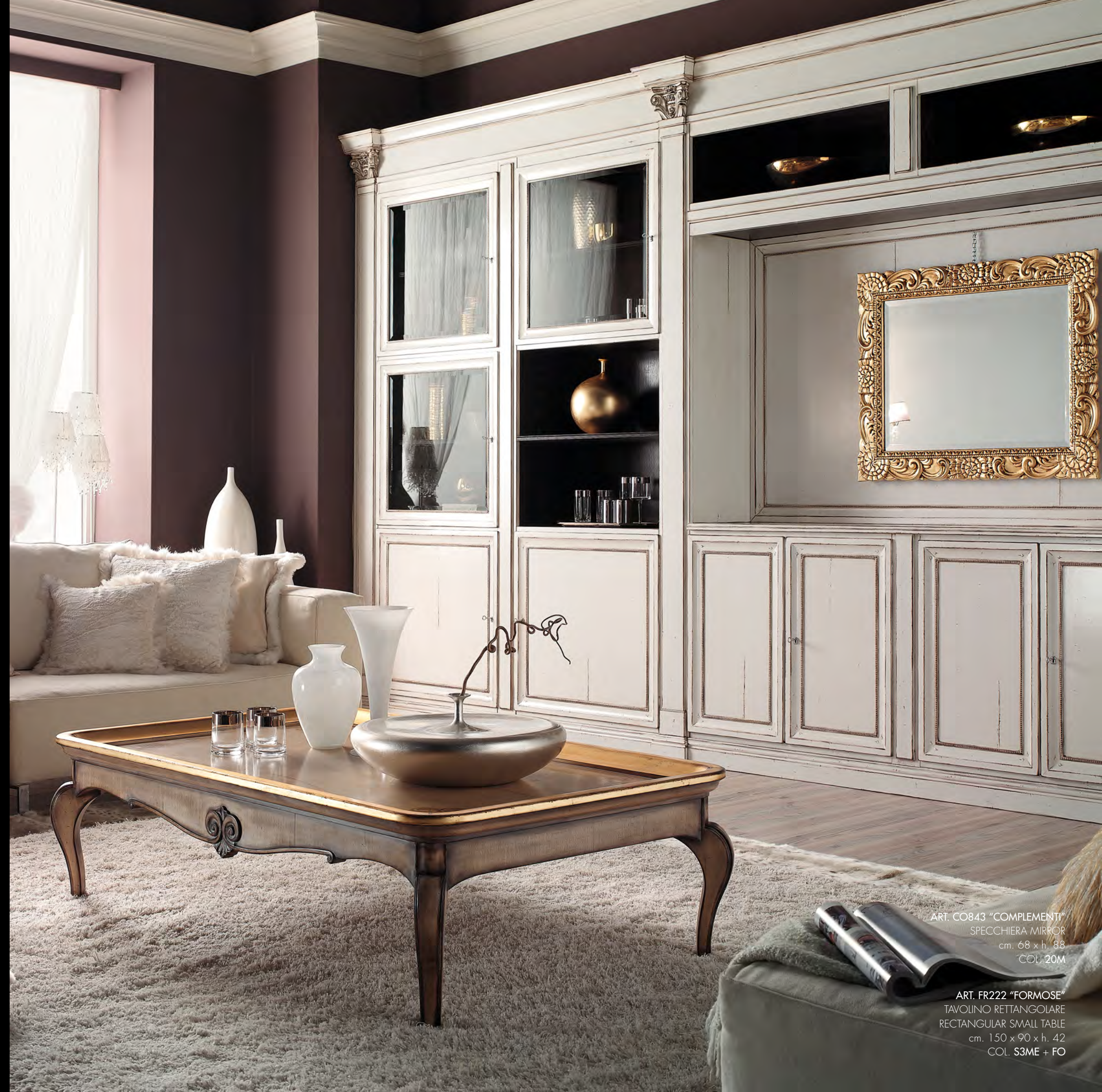
ART. CO843 "COMPLEMENTI" SPECCHIERA MIRROR cm. 68 x h. 88 COL. 20M