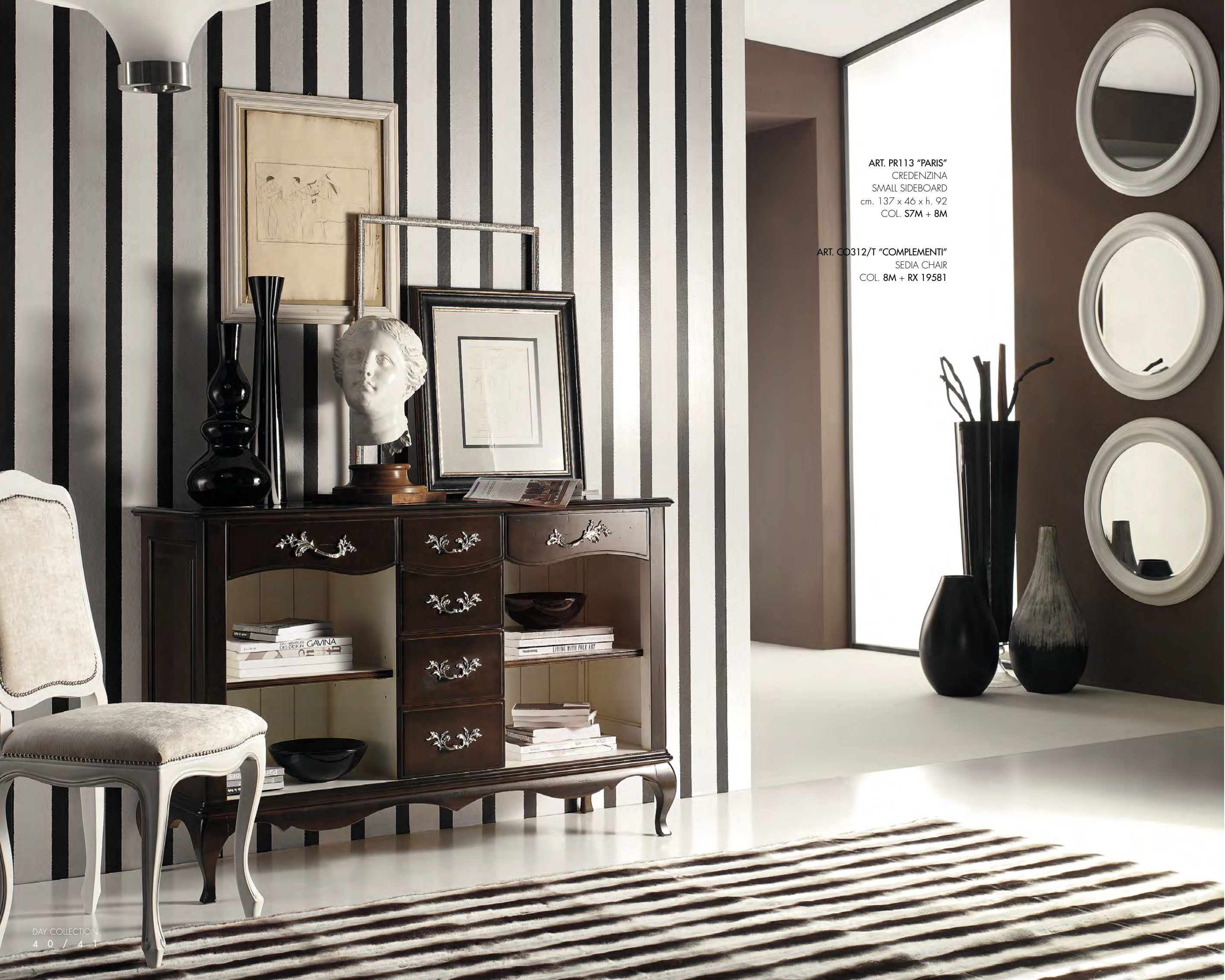
ART. PR113 "PARIS" CREDENZINA SMALL SIDEBOARD cm. 137 x 46 x h. 92 COL. S7M + 8M