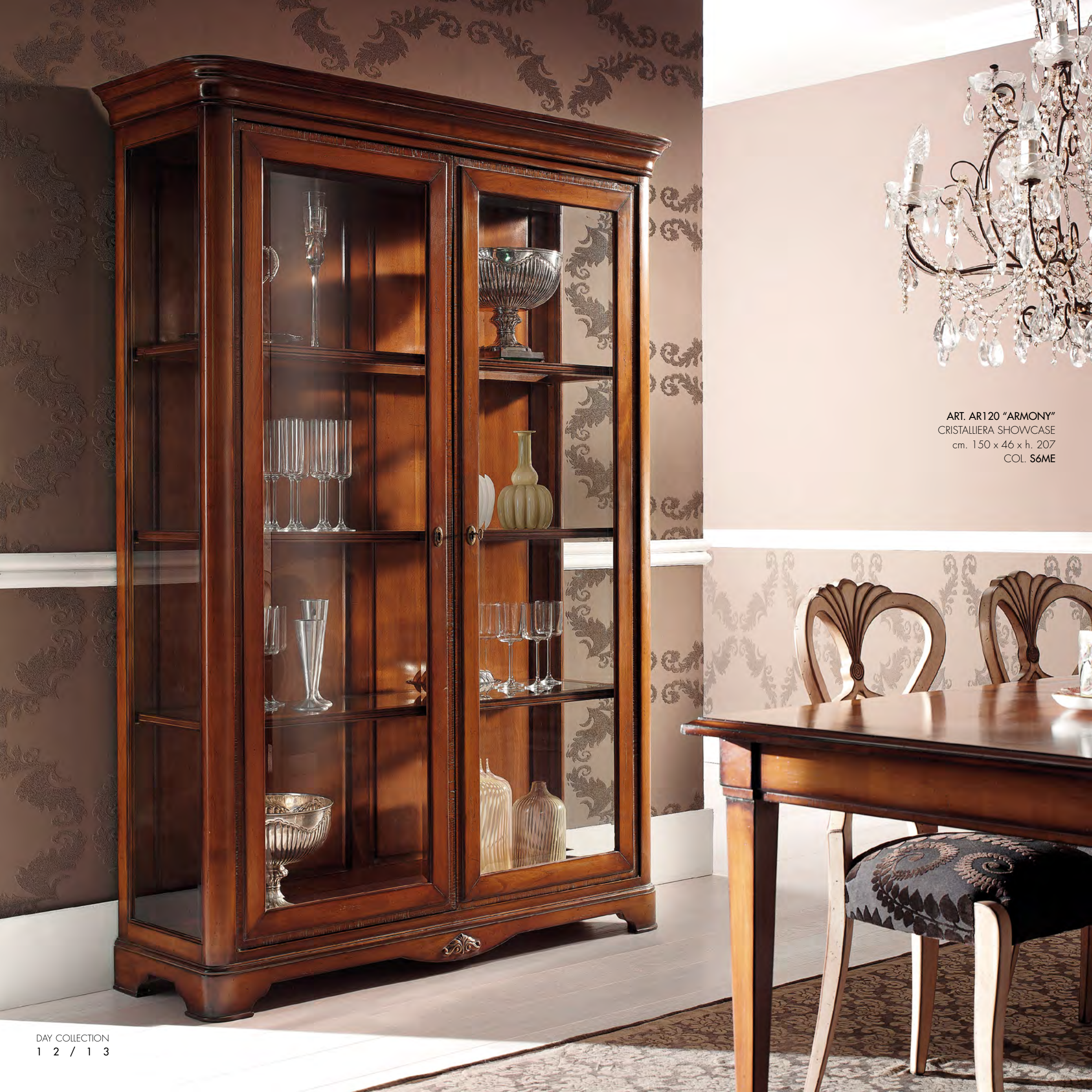
ART. AR120 "ARMONY" CRISTALLIERA SHOWCASE cm. 150 x 46 x h. 207 COL. S6ME

NUOVE ESIGENZE UNITE A FORME DI ANTICO SENTORE, PRATICA EVOLUZIONE PER L'ORDINE IN CASA. UNA NUOVA SCANSIONE DI SPAZI...NUOVI PERCORSI NELL'ARREDARE CHE MAI DIMENTICANO LA CONCRETEZZA DEL VIVERE. NEW DEMANDS ARE COMBINED WITH ANTIQUE FORMS, A PRACTICAL EVOLUTION OF A CLEAN AND TIDY HOME. A NEW ARRANGEMENT TO THE SPACE...BREAKING NEW ROADS IN FURNISHING THAT NEVER FORGET SOUND AND SOLID GOOD LIVING.