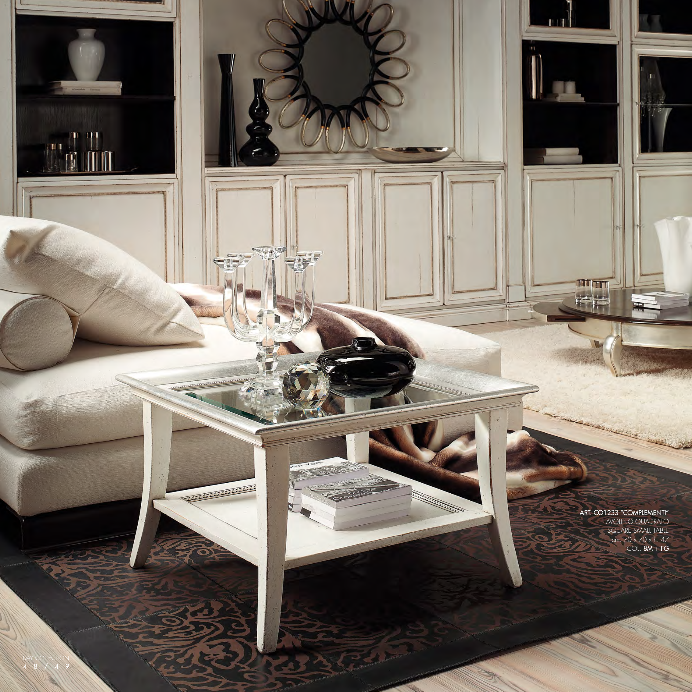
ART. CO1233 "COMPLEMENTI" TAVOLINO QUADRATO SQUARE SMALL TABLE cm. 70 x 70 x h. 47 COL. 8M + FG

IDEALE PER CREARE SITUAZIONI ACCOGLIENTI ED AMBIENTI DI STILE, CON UNA GRANDE LIBERTÀ DI POSIZIONE E DI UTILIZZO. THE IDEAL FURNISHING TO OFFER INVITING INTERIORS IN STYLE WITH THE GREATEST FREEDOM IN POSITIONING AND USE.