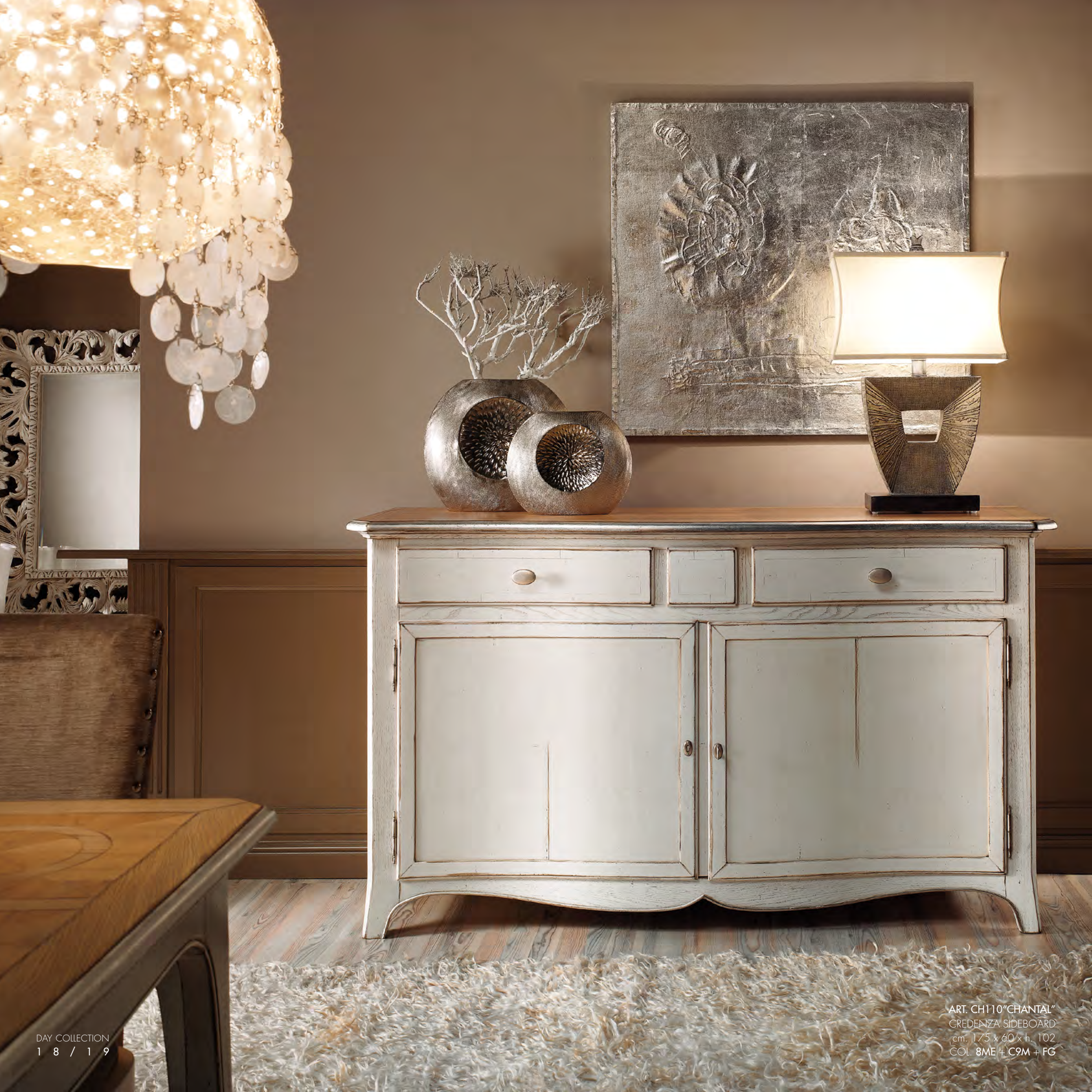
ART. CH110 "CHANTAL" GREDEZZA SIDEBOARD cm. 175 x 60 x h. 102 COL. 8ME + C9M + FG