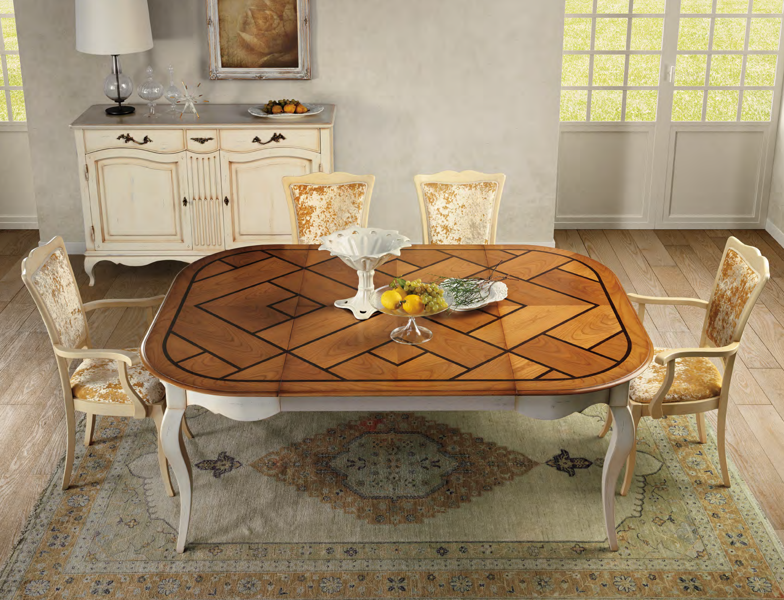
ART. PR211 "PARIS" TAVOLO OVALE OVAL TABLE cm. 150 x 115 x h. 78 CHIUSO/CLOSE cm. 150 x 199 x h. 78 APERTO/OPEN COL. 8M + C9M