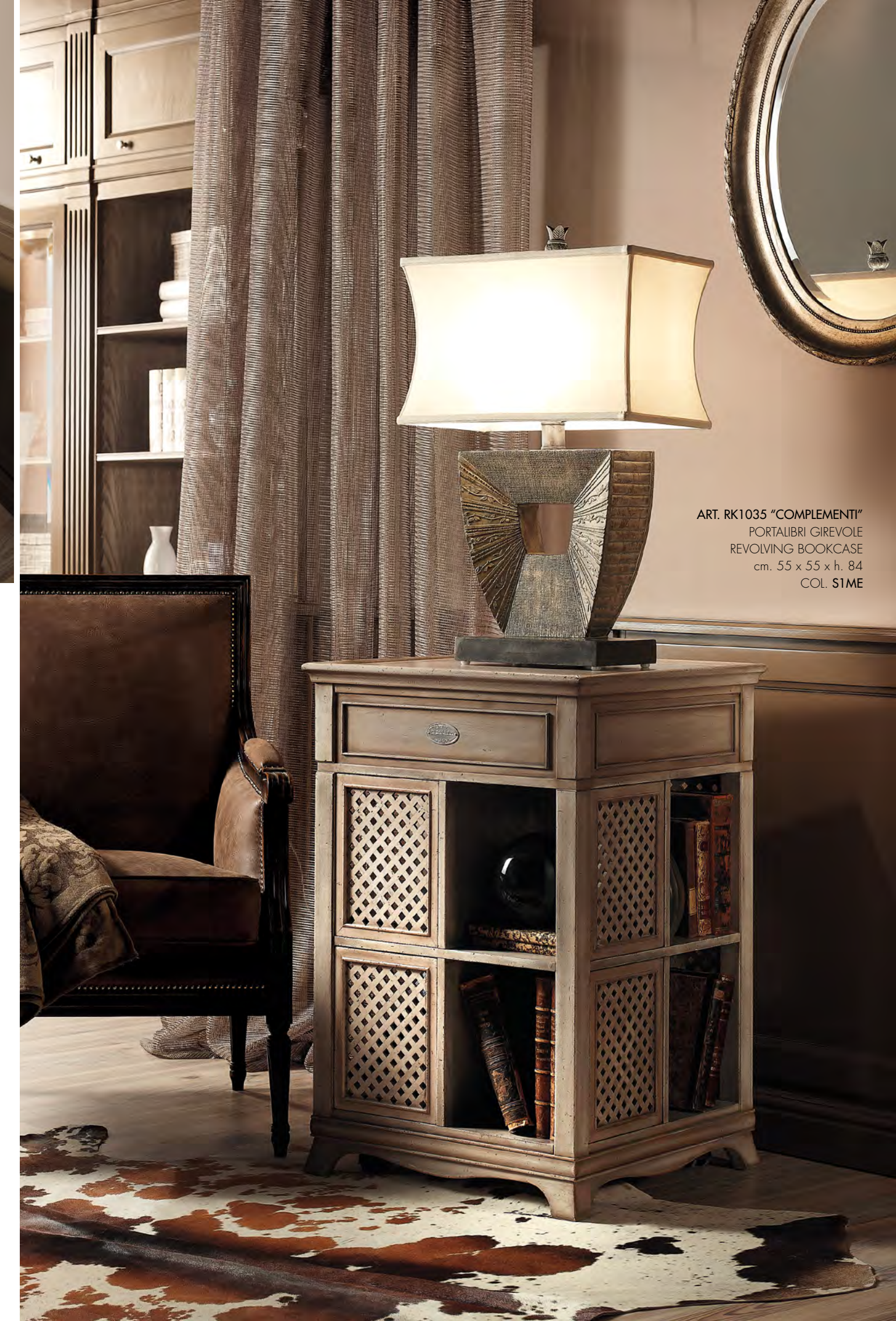
ART. RK1035 "COMPLEMENTI" PORTALIBRI GREVOLE REVOLVING BOOKCASE cm. 55 x 55 x h. 84 COL. S1ME

ESSENZE PREGIATE, PERFEZIONE NELLE FORME, ACCURATEZZA NEI DETTAGLI, PUREZZA E RESISTENZA DEL LEGNO, TUTTO GARANTISCE BELLEZZA E PREZIOSITÀ ALLA COLLEZIONE. PRACTICALITY, BEAUTIFUL SHAPES, ATTENTION TO DETAIL, THE PURITY AND DURABILITY OF THE WOOD, ALL GUARANTEE THE EXCEPTIONAL QUALITY OF THE COLLECTION.