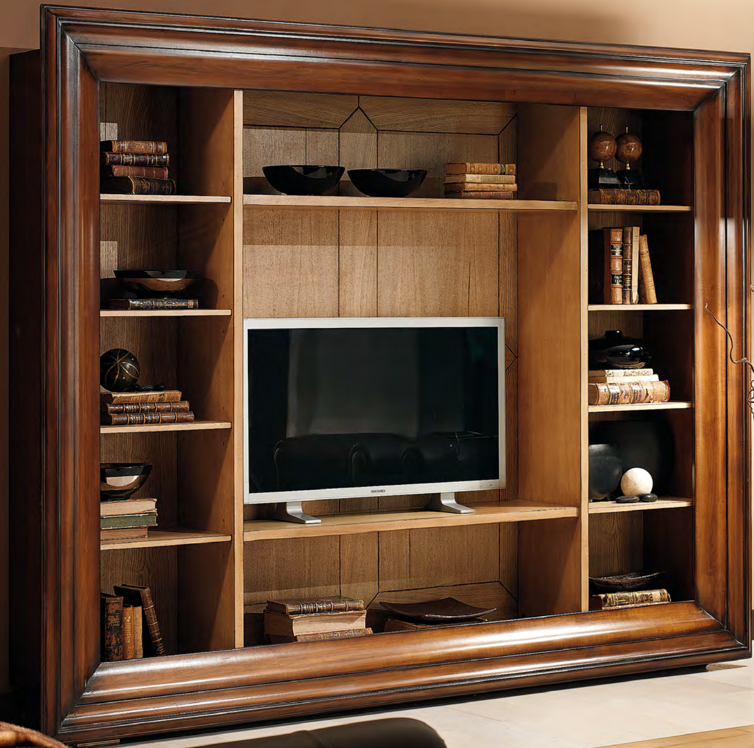
ART. PL822 "PLESIRE" LIBRERIA BOOKCASE cm. 250 x 48 x h. 200 COL. S6ME + S2ME