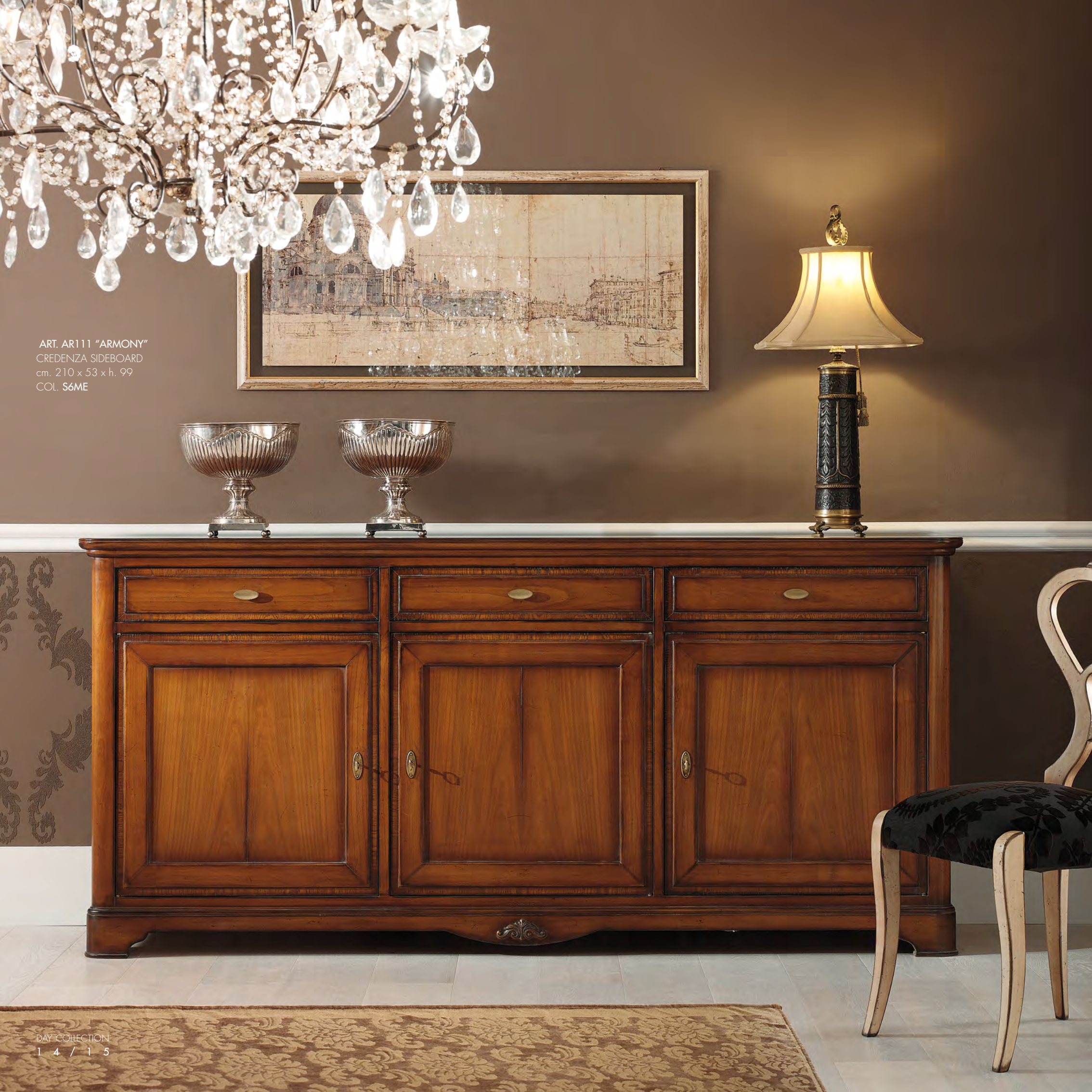
ART. AR111 "ARMONY" CREDENZA SIDEBOARD cm. 210 x 53 x h. 99 COL. S6ME