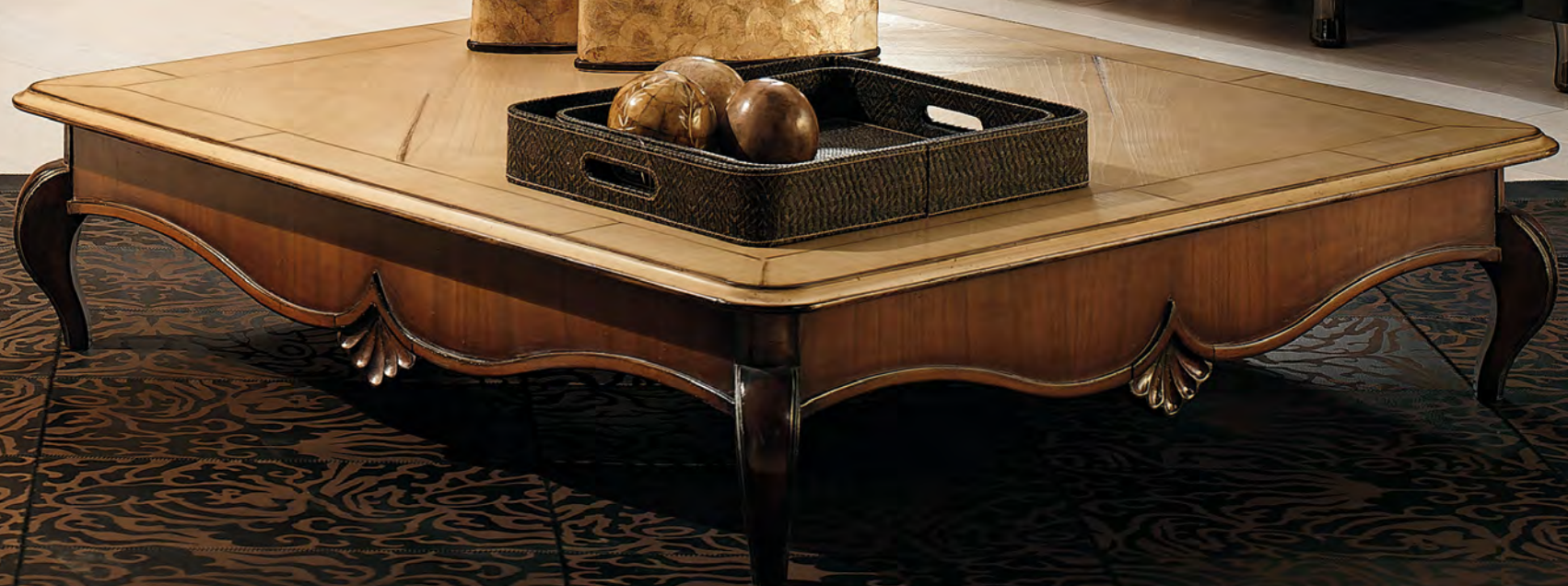
ART. FR221 "FORMOSE" TAVOLINO QUADRATO SQUARE SMALL TABLE cm. 120 x 120 x h. 30 COL. S6ME + S2ME