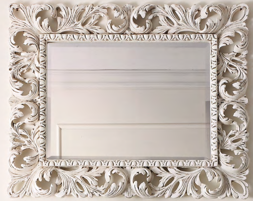
ART. CO840 "COMPLEMENTI" SPECCHIERA INTAGLIATA CARVING MIRROR cm. 87 x h. 107 COL. 8M