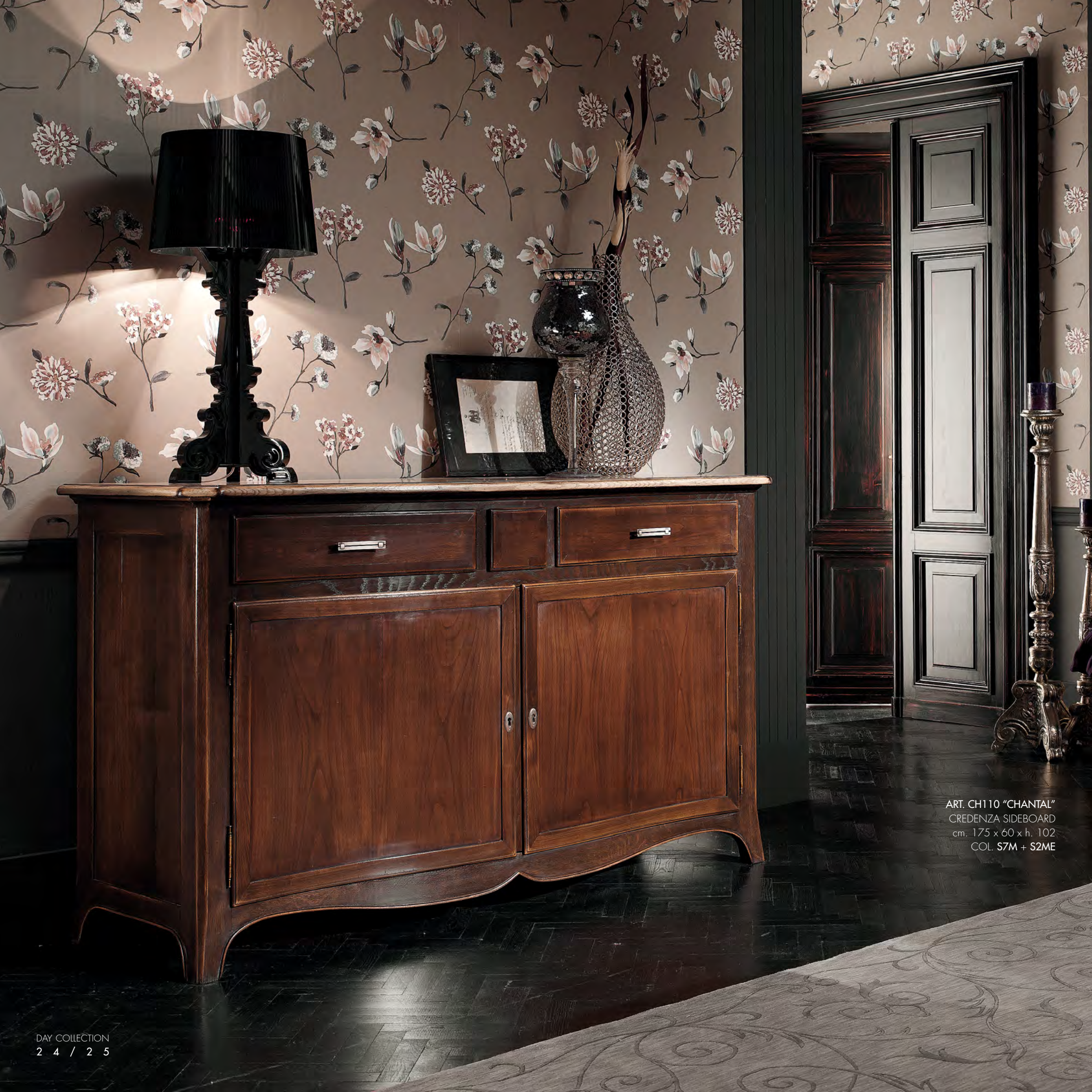
ART. CH110 "CHANTAL" CREDENZA SIDEBOARD cm. 175 x 60 x h. 102 COL. S7M + S2ME