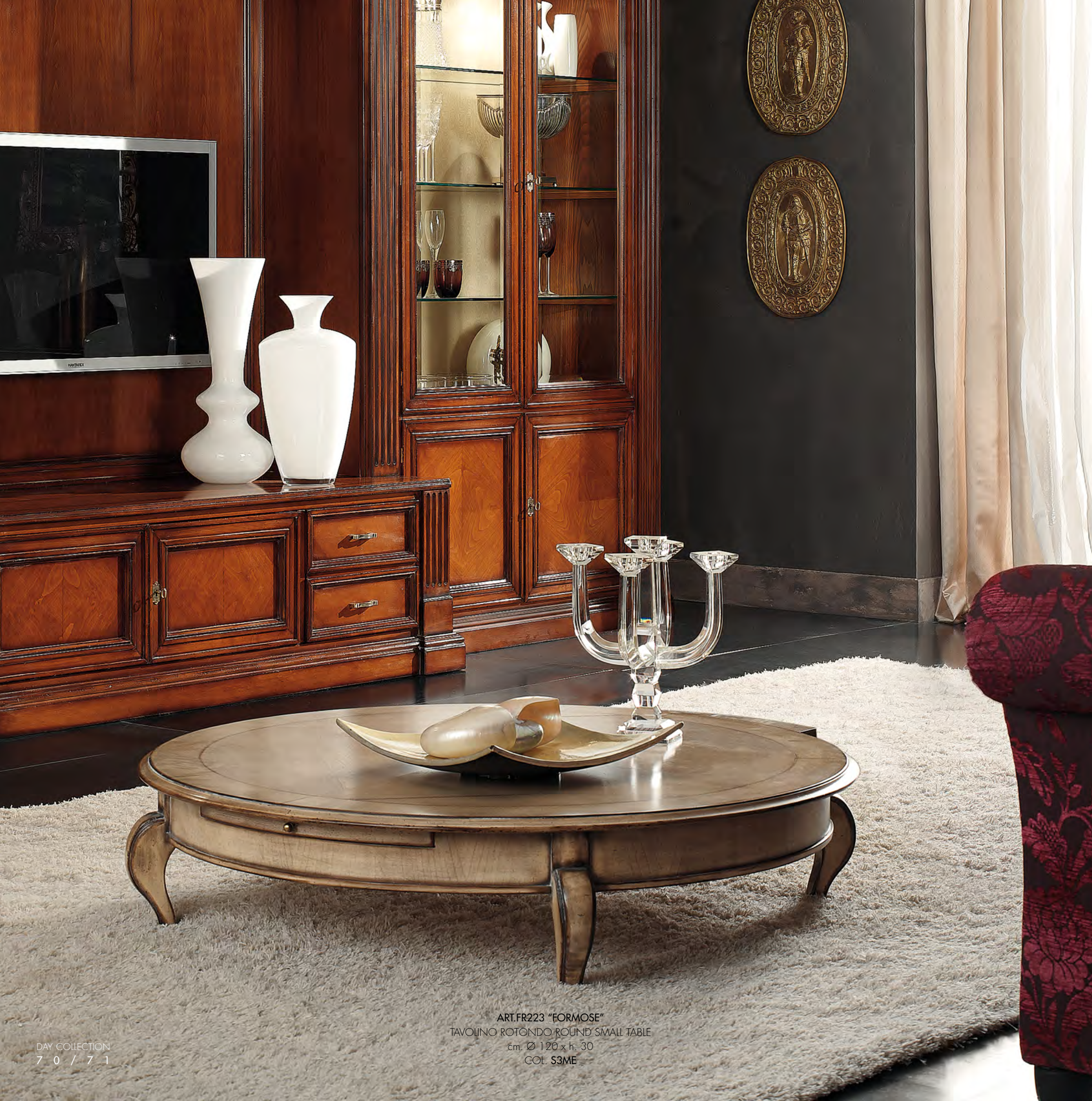
ART.FR223 "FORMOSE" TAVOLINO ROTONDO ROUND SMALL TABLE cm. Ø 120 x h. 30 COL. S3ME