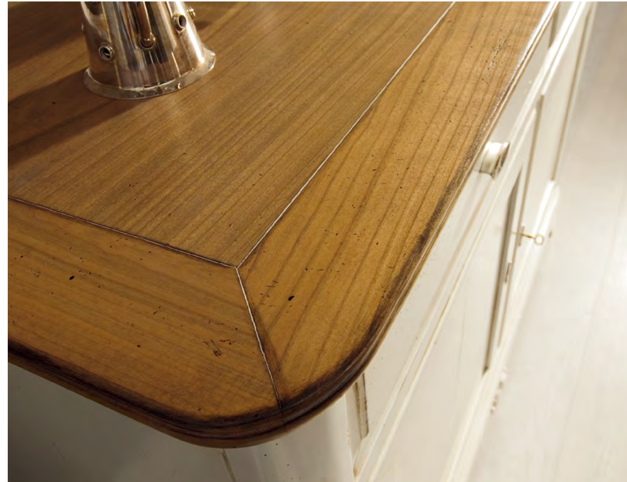
ART. AR110 "ARMONY" CREDENZA SIDBOARD cm. 143 x 53 x h. 99 COL. 8ME + C9M