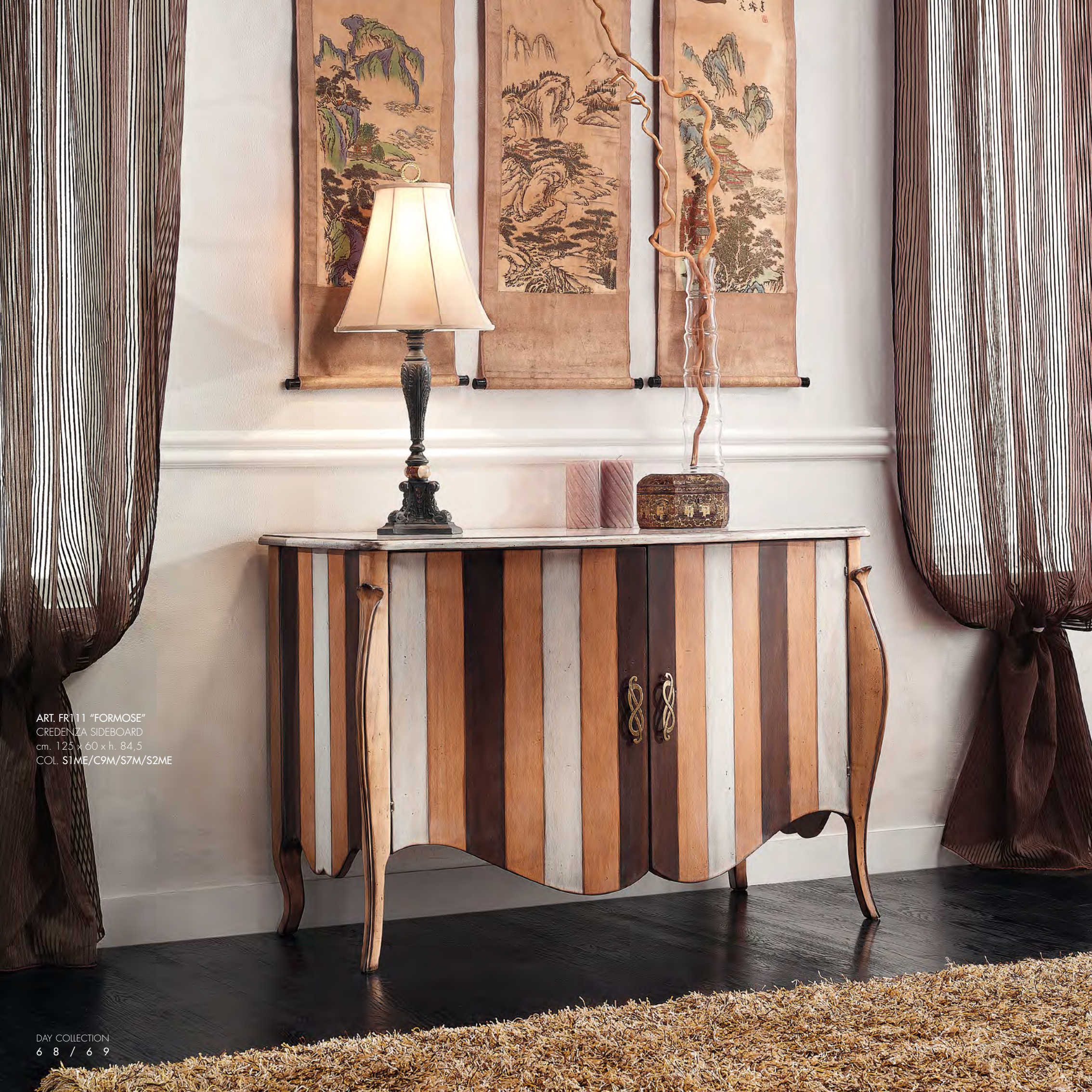
ART. FR111 "FORMOSE" CREDENZA SIDEBOARD cm. 125 x 60 x h. 84,5 COL. S1ME/C9M/S7M/S2ME

A L L T H E F O R C E O F T R A D I T I O N