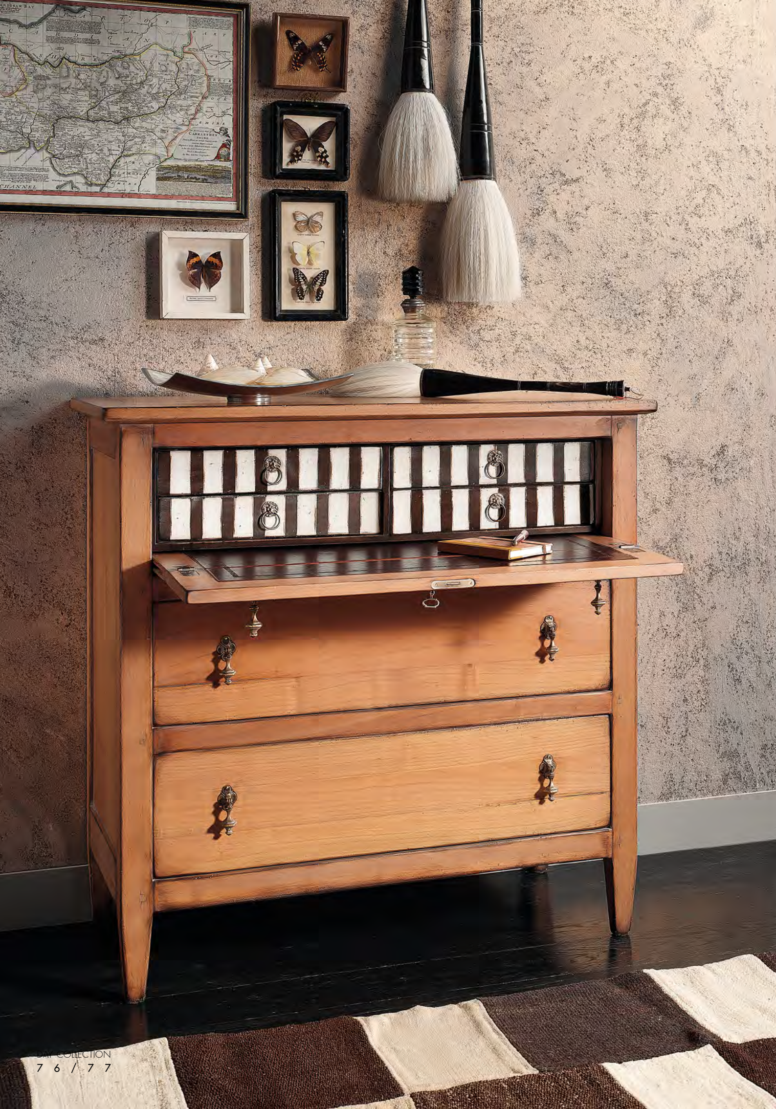
ART. DR810 "DIRETTORIO" COMONCINO SMALL CHEST OF DRAWERS cm. 94 x 48 x h. 94 COL. S4ME + S7M-8M + CAST32