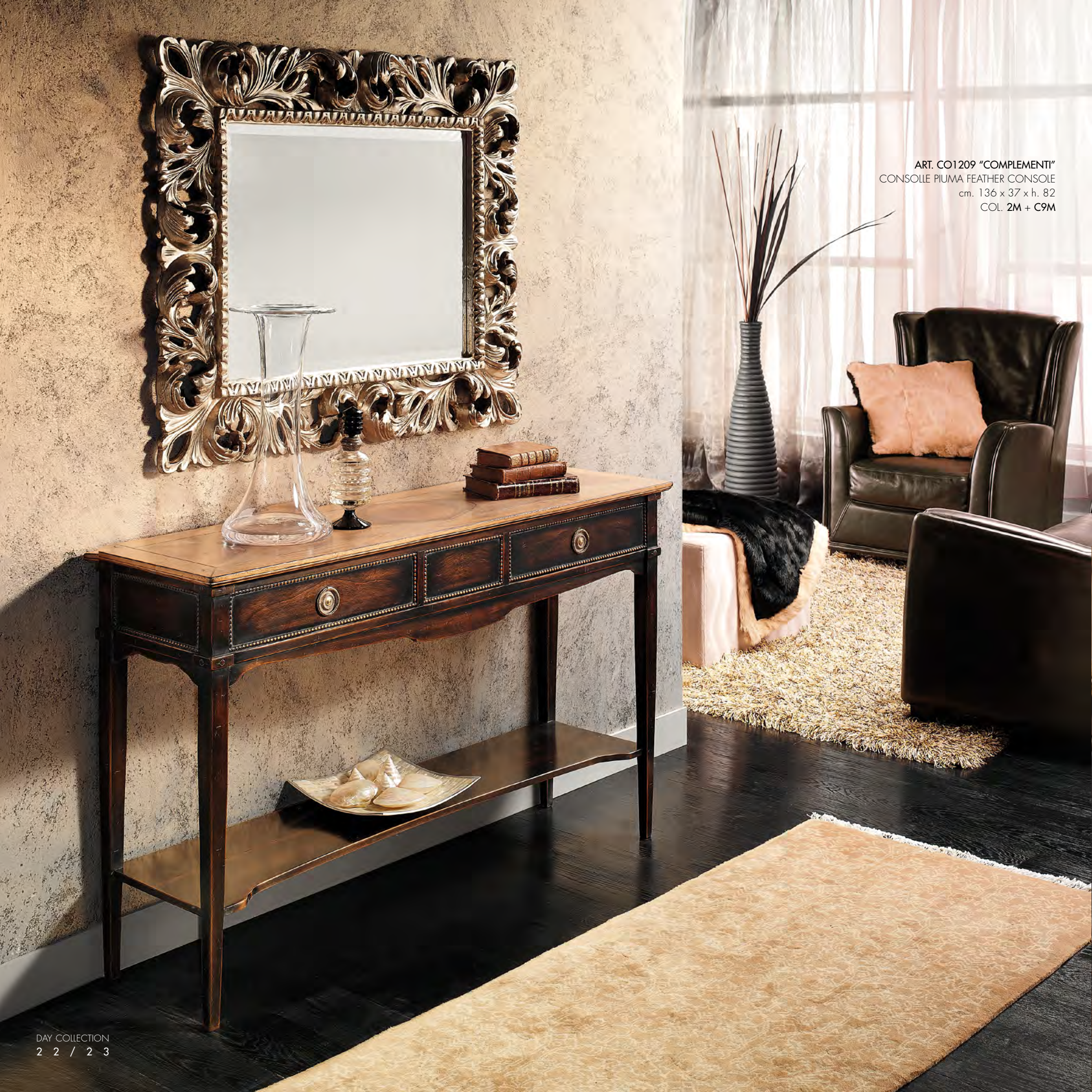
ART. CO1209 "COMPLEMENTI" CONSOLLE PIUMA FEATHER CONSOLE cm. 136 x 37 x h. 82 COL. 2M + C9M