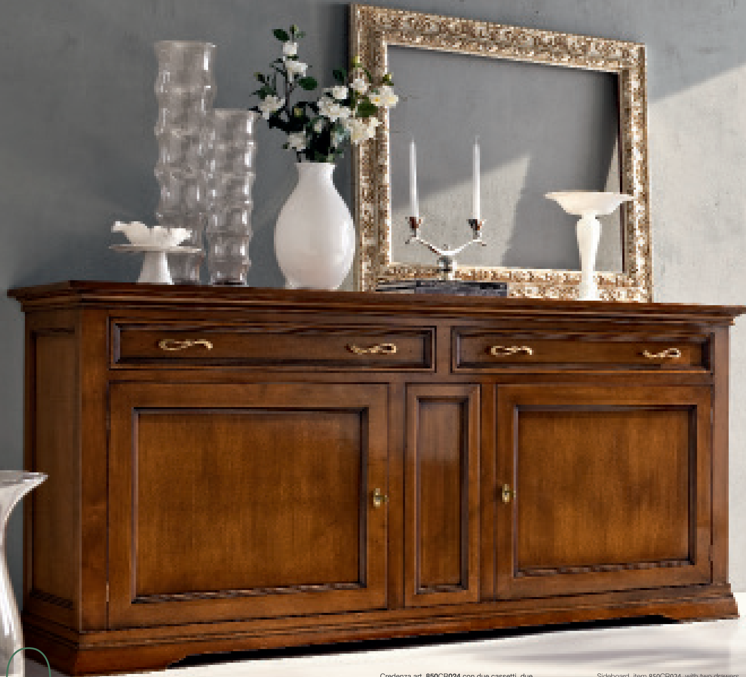
Credenza art. 850CR024 con due cassetti, due ante battenti e segreto. Finitura noce per questo mobile realizzato in legno massello.