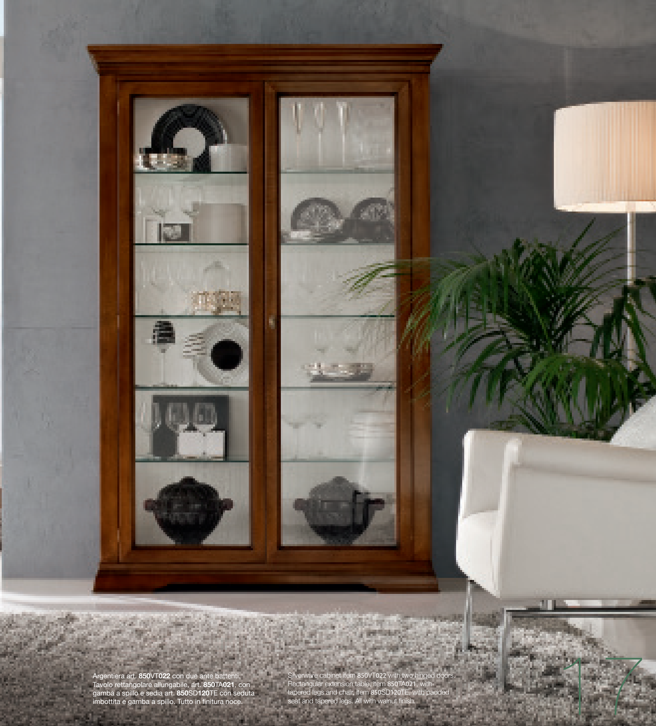
Argenteria art. 850VT022 con due ante battenti. Tavolo rettangolare allungabile, art. 850TA021 , con gamba a spillo e sedia art. 850SD120TE con seduta imbottita e gamba a spillo. Tutto in finitura noce.