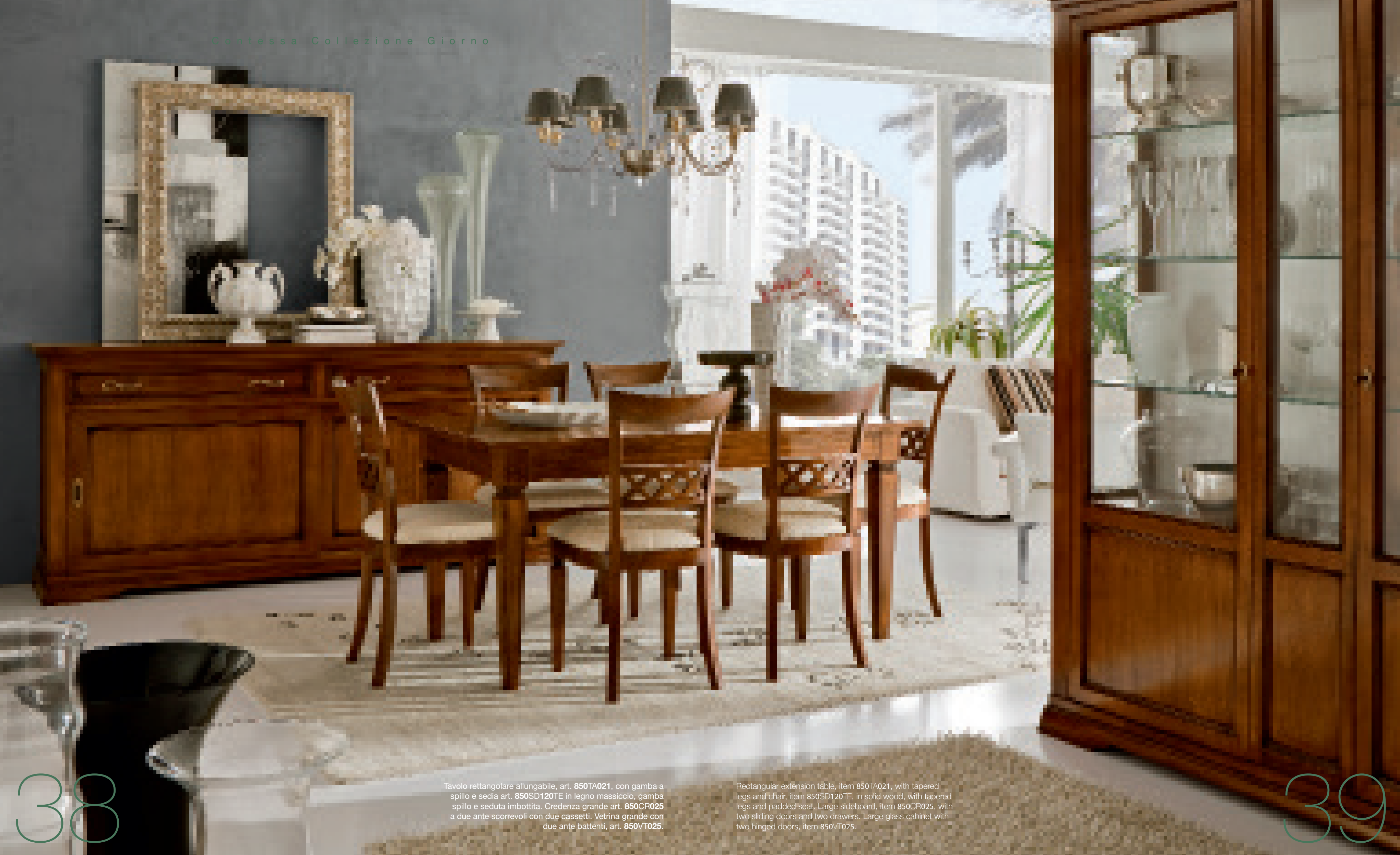
Tavolo rettangolare allungabile, art. 850TA021, con gamba a spillo e sedia art. 850SD120TE in legno massiccio, gamba spillo e seduta imbottita. Credenza grande art. 850CR025 a due ante scorrevoli con due cassetti. Vetrina grande con due ante battenti, art. 850VT025.