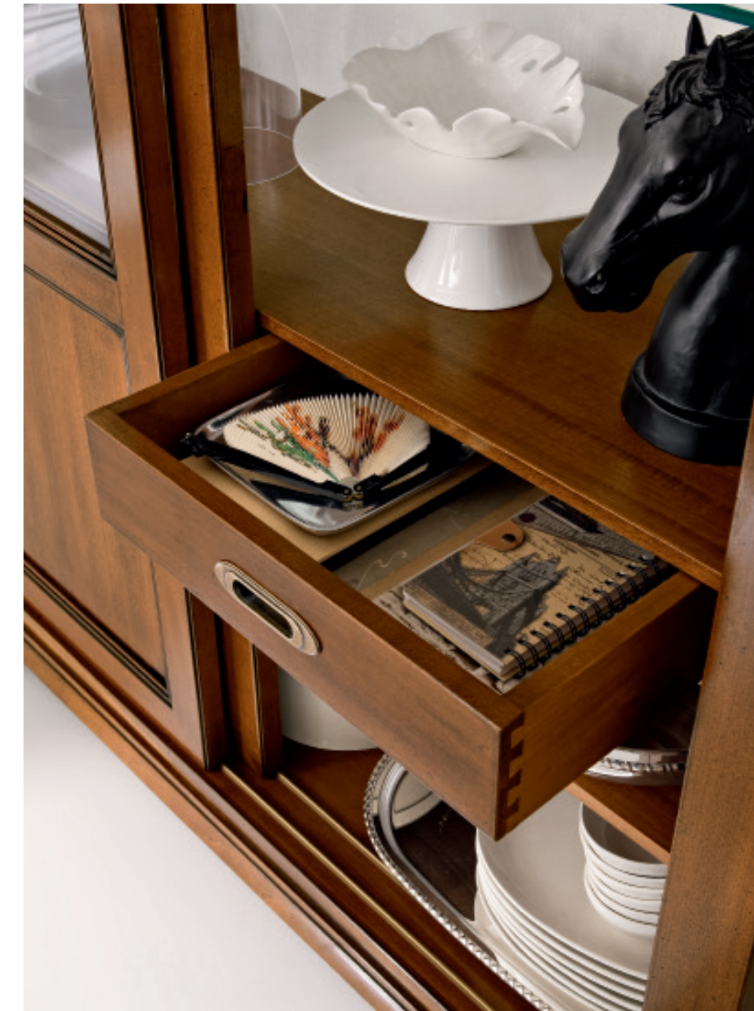
La vetrina, art. 850VT024 , esprime a pieno l'unicità e la linea classica della collezione Contessa, proponendo al suo interno dei cassetti ideali per racchiudere i vostri effetti.

The glass cabinet, item 850VT024 , fully conveys the unique and classic line of the Contessa collection, housing drawers that are ideal for storing your personal objects.