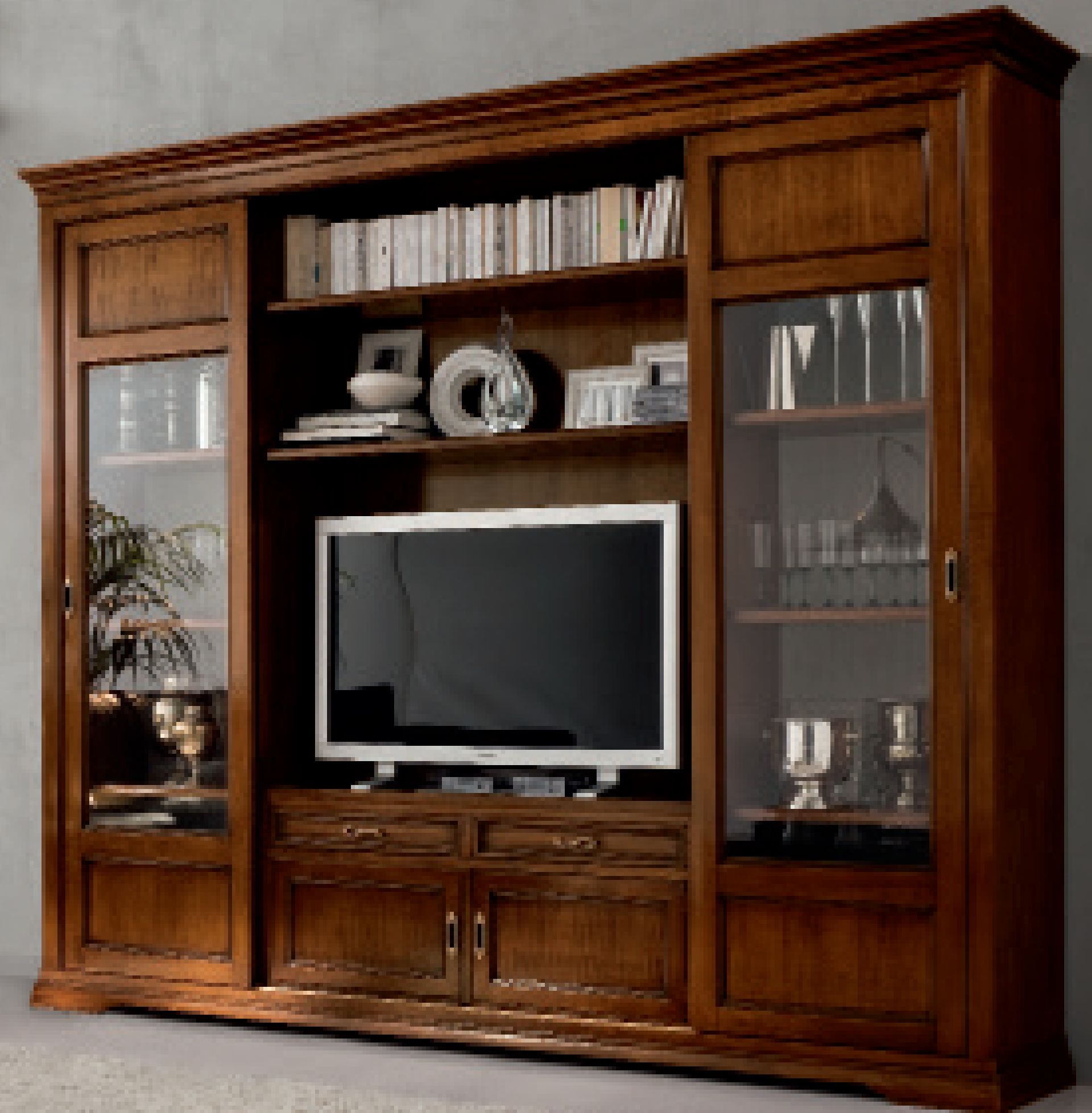
Tavolino rettangolare art. 850TN021 con cassetto. Mobile parete art. 850PR020 con ante scorrevoli e due cassetti. Tutto in legno finitura noce.