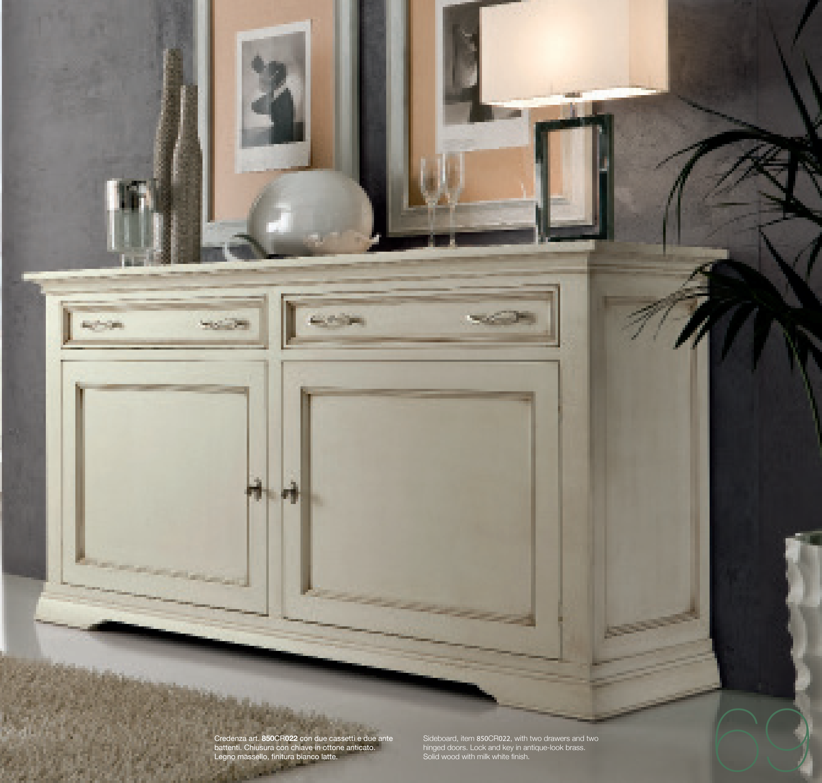
Credenza art. 850CR022 con due cassetti e due ante battenti. Chiusura con chiave in ottone anticato. Legno massello, finitura bianco latte.