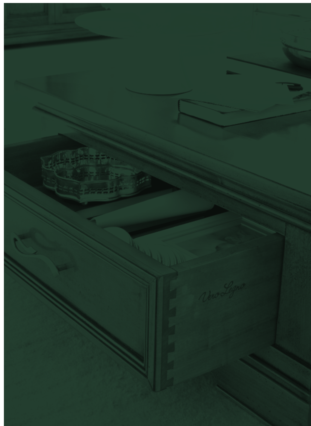
Tavolino quadrato, art. 850TN020 , con cassetto. Ideale per racchiudere i vostri oggetti personali. Nel cassetto, una firma "Vero Legno" per ricordare l'utilizzo del legno massello, in questo caso in finitura noce.

Square occasional table, item 850TN020 , with drawer, ideal for storing your personal objects. The words "Vero Legno" in the drawer remind you of its solid wood, in this case, with walnut finish.