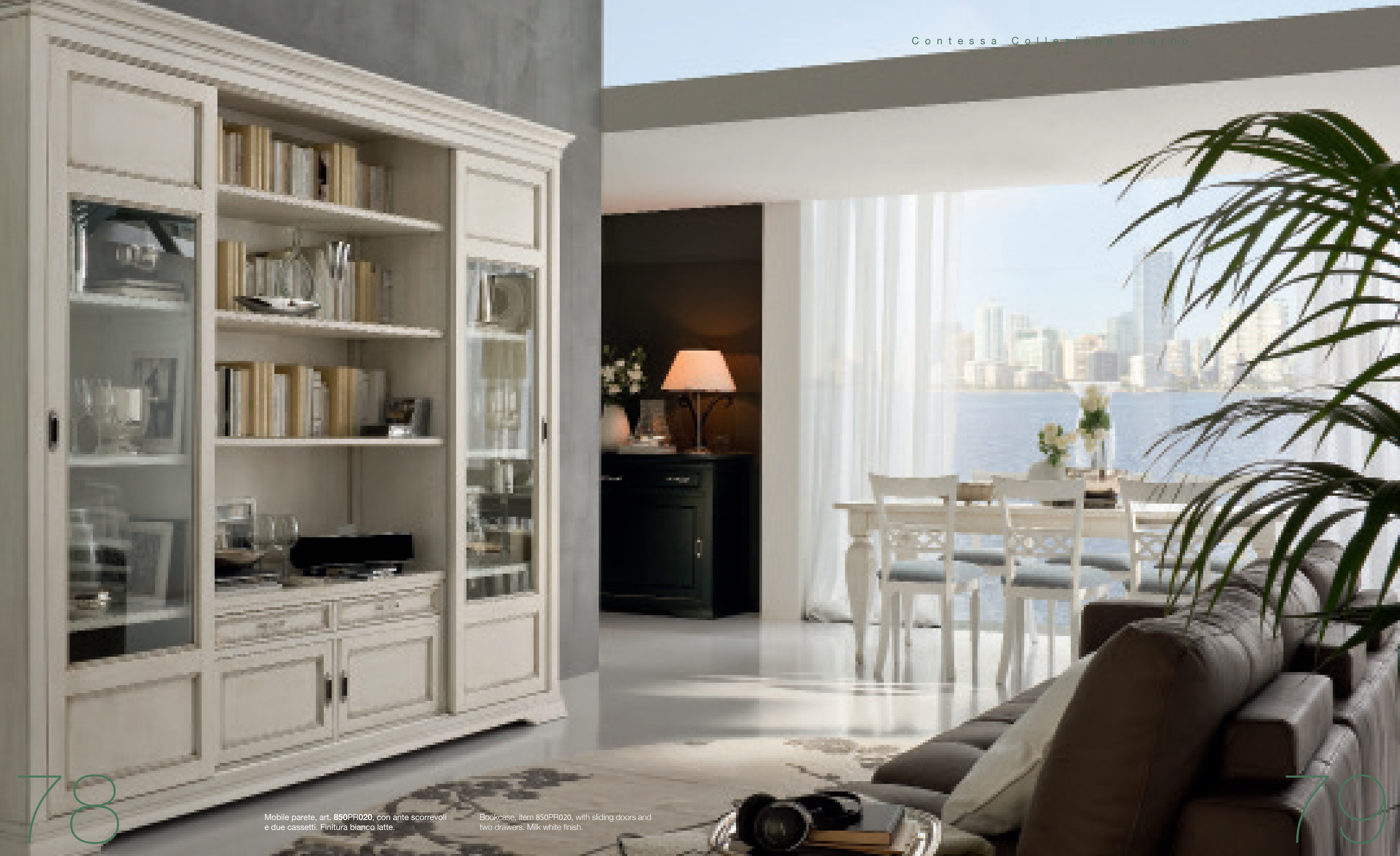
Mobile parete, art. 850PR020, con ante scorrevoli e due cassetti. Finitura bianco latte.