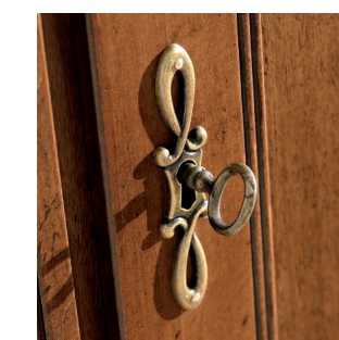
Chiusura con chiave Closure with key