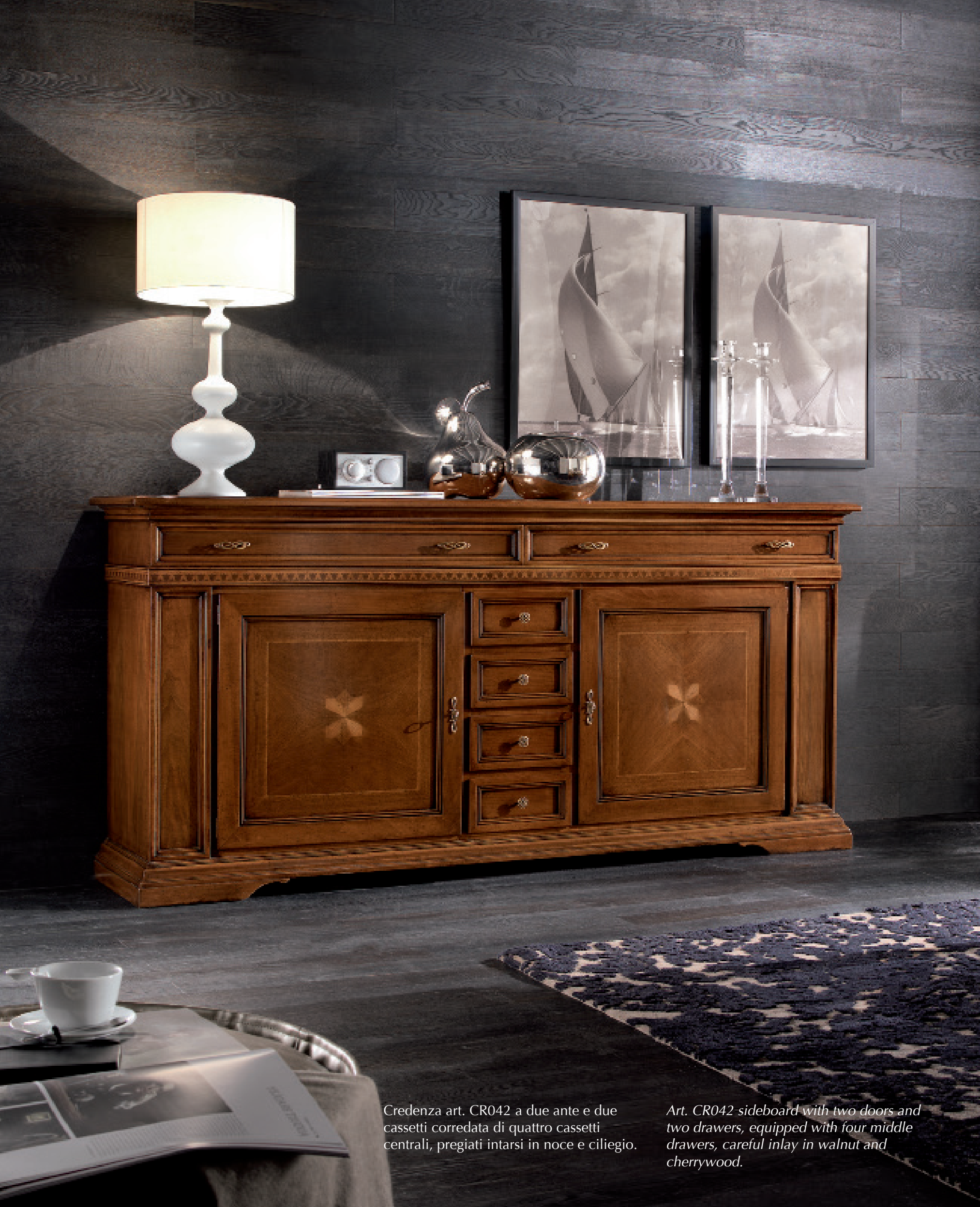
Credenza art. CR042 a due ante e due cassetti corredata di quattro cassetti centrali, pregiati intarsi in noce e ciliegio.