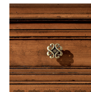
Pomolo a fiore Flowerly knob