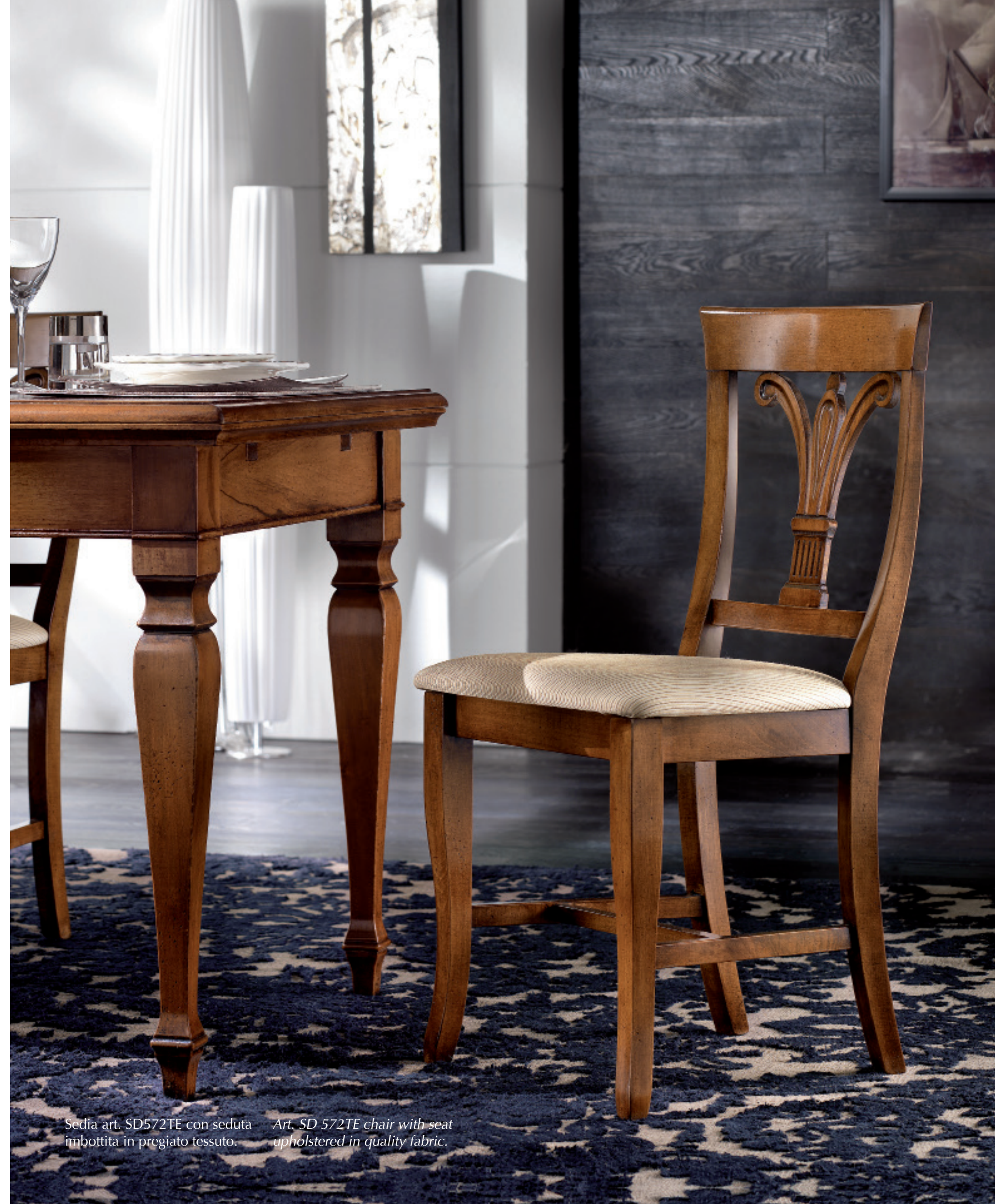
Sedia art. SD572TE con seduta imbottita in pregiato tessuto.

The chairs can be customised and will make the living-room collections unique at any time. Quality fabrics for coordinating with the seats or the back make the living-room sober or informal according to contemporary needs.