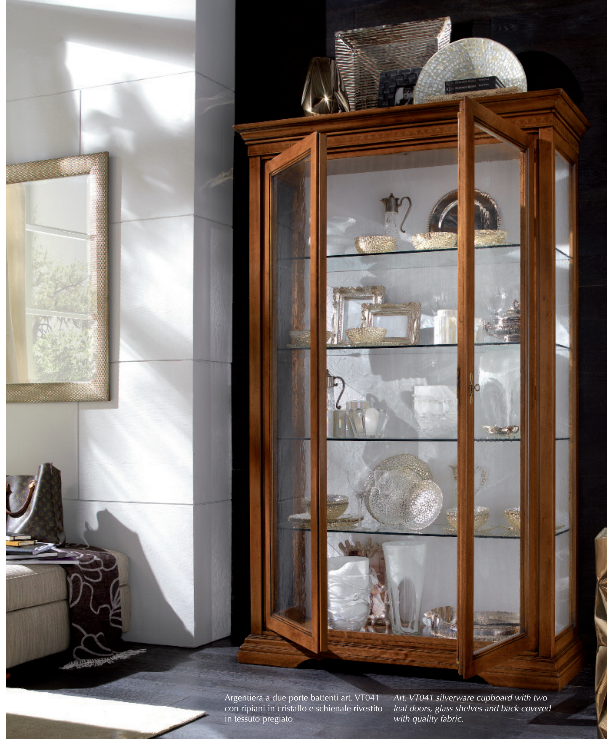
Argentiera a due porte battenti art. VT041 con ripiani in cristallo e schienale rivestito in tessuto pregiato

A space enclosed by worked glass and a careful frame in solid wood. A piece of furniture evoking the tradition, classic materials, and reflecting the light of skilfully worked glass.