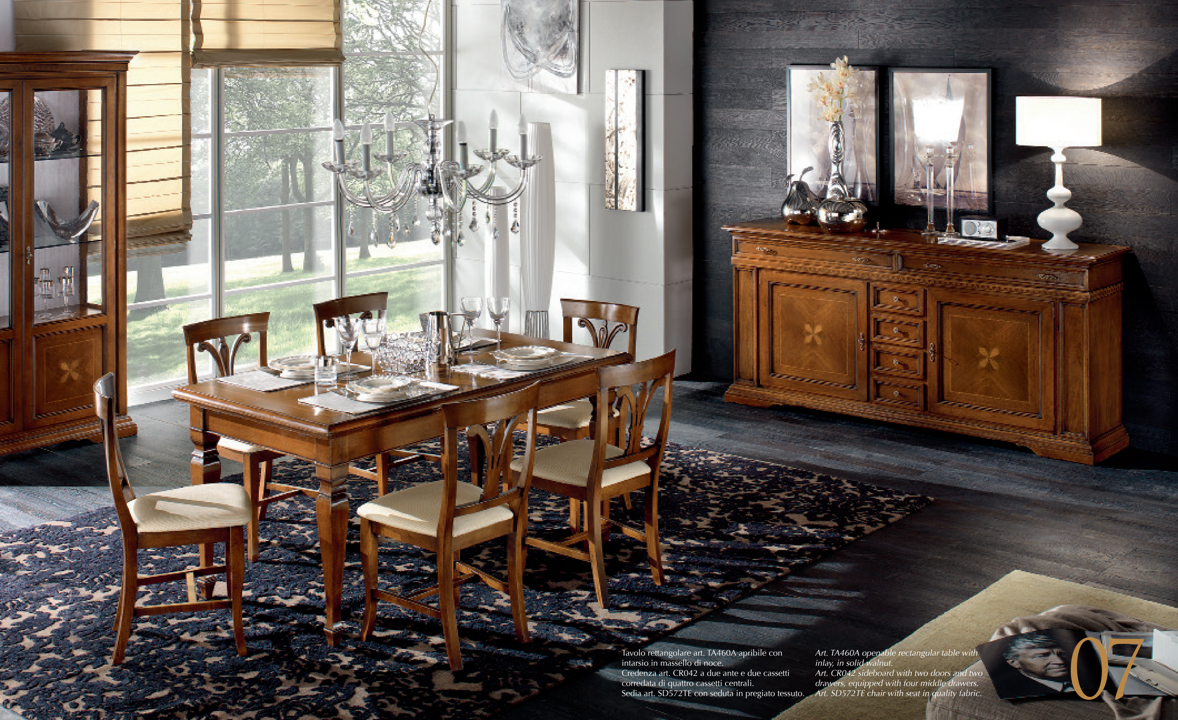
Tavolo rettangolare art. TA460A apribile con intarsio in massello di noce. Credenza art. CR042 a due ante e due cassetti corredata di quattro cassetti centrali. Sedia art. SD572TE con seduta in pregiato tessuto.