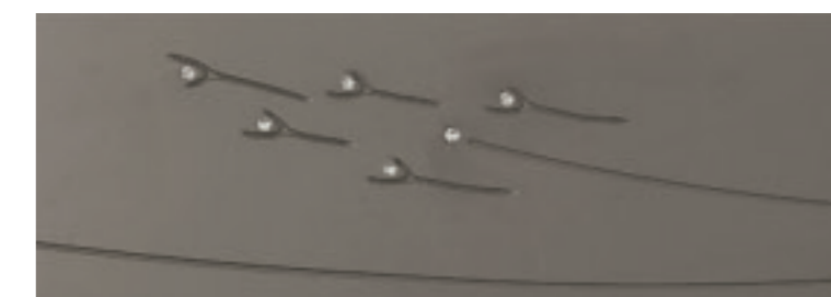
LACCATO GRIGIO PIACENZA 130 CON INCISIONE E CRISTALLI Piacenza grey 130 lacquer with engraving and crystals