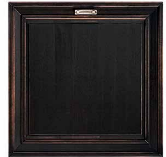
NERO INVECCHIATO AGED BLACK