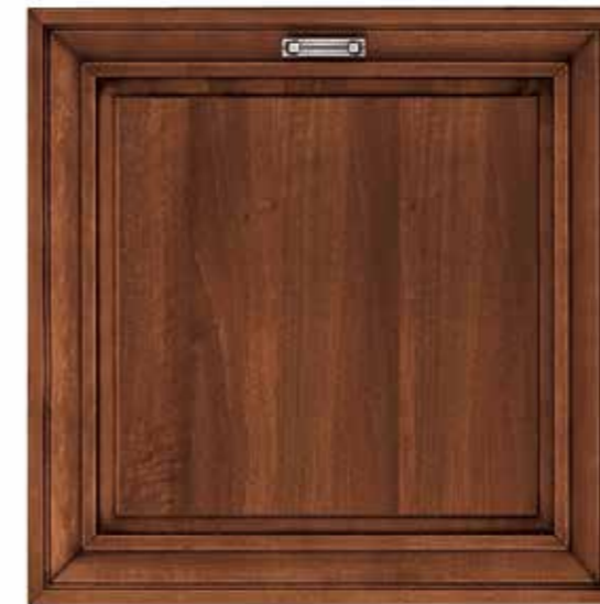
NOCE ESSENZA WALNUT WOOD