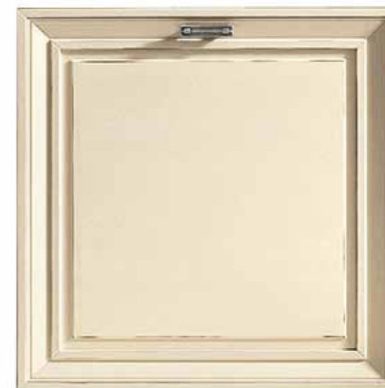
PANNA LACCATO CREAM LACQUER